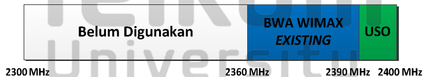
Gambar 1.1 Alokasi frekuensi 2300 MHz di Indonesia [4]

LTE dapat beroperasi pada frekuensi yang beragam. Dari semua frekuensi yang tersedia, beberapa kandidat frekuensi yang potensial untuk dioperasikannya LTE di Indonesia yaitu 700 MHz, 2300 MHz dan 1800 MHz. Pada tugas akhir ini, LTE dimodelkan beroperasi pada frekuensi 2300 MHz. Secara regulasi, frekuensi 2300 MHz telah diatur dalam koordinasi penggunaan pita frekuensi radio 2300 MHz untuk layanan pita lebar nirkabel ( wireless broadband ) berbasis netral teknologi [2] .