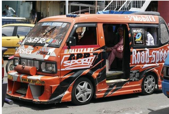
Gambar 1.1 Angkot Modifikasi Padang