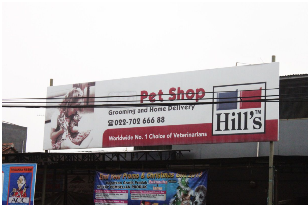
Gambar 1.2 Billboard Maxi Pet Shop