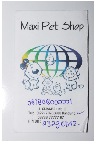
Gambar 1.1 Business Card Maxi Pet Shop