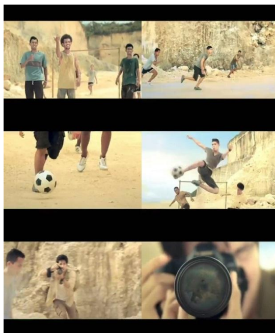
Gambar 1.1 Screen Shot Iklan Men's Biore versi "Adventure Football"