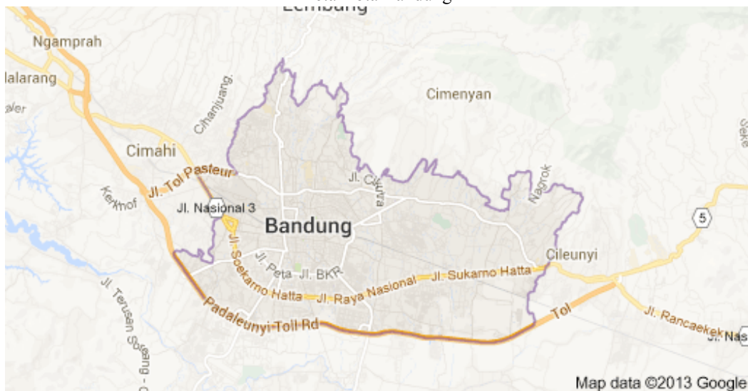
Gambar 1.1 Peta Kota Bandung

Kota Bandung merupakan kota metropolitan terbesar di Jawa Barat sekaligus menjadi ibu kota provinsi tersebut. Kota ini terletak 140 km sebelah tenggara Jakarta, dan merupakan kota terbesar ketiga di Indonesia setelah Jakarta dan Surabaya menurut jumlah penduduk. Kota Bandung merupakan kota terpadat di Jawa Barat, di mana penduduknya didominasi oleh etnis Sunda, sedangkan etnis Jawa merupakan penduduk minoritas terbesar di kota ini dibandingkan etnis lainnya. (Sumber: Wikipedia, 2014)