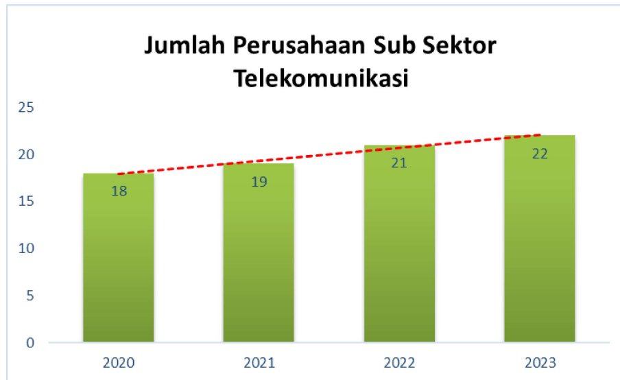
Gambar 1. 2 Jumlah Perusahaan Sub Sektor Telekomunikasi periode 2020