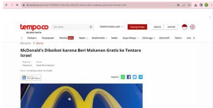
Gambar 1. 2 Berita mengenai MC Donald’s beri makan grátis ke tentara Israel