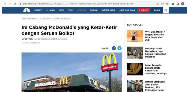
Gambar 1. 3 Berita cabang Mc Donald’s ketar ketir dengan seruan biokot

Penurunan saham McDonald’s ini timbul ketika McDonald’s Israel menyumbangkan makanan siap saji mereka kepada tentara Israel (IDF) yang notabene nya tentara yang banyak menghilangkan nyawa warga sipil Palestina yang tidak bersalah. Mengutip dari situs pemberitaan Tempo.com yang dilaporkan oleh Newsweek, Mc Donald’s Israel menyumbangkan 4.000 makanan ke unit militer lalu rumah sakit. Mereka juga setiap harinya memberikan ribuan makanan, dan diskon kepada tentara lapangan daerah wajib militer.