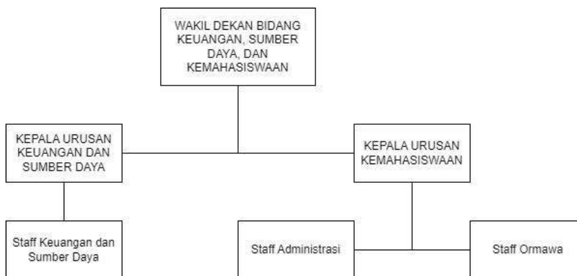
Gambar I.3 Struktur Organisasi Urusan Keuangan, Sumber Daya dan Kemahasiswaan

Dalam Struktur Organisasi TPA FRI terdapat dua wakil dekan yang mempunyai masing- masing bidang yaitu urusan akademik dan dukungan penelitian dan urusan keuangan, sumber daya dan kemahasiswaan. Fokus penelitian pada tugas akhir ini merujuk pada urusan keuangan dan sumber daya serta kemahasiswaan. Dibawah jabatan tersebut terdapat dua divisi yang dipimpin oleh kepala urusan Keuangan dan Sumber daya sekaligus keuangan dan Kepala Urusan kemahasiswaan.