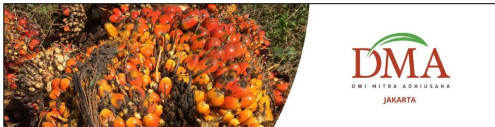
Gambar 1. 3 Tendan Buah Segar Kelapa Sawit

Perusahaan berfokus pada kegiatan usaha pada penanaman tanaman kelapa sawit dan pemanenan tendan buah segar (TBS) yang kemudian akan dijual kepada pabrik pengolahan kelapa sawit maupun distributor. Selain itu perusahaan ini juga melakukan kerjasama dengan dua koperasi dalam bentuk plasma. Perusahaan ini memiliki beberapa anak perusahaan yang bergerak diberbagai bidang seperti dibidang kelapa sawit yaitu PT. Candi Artha, bidang perkebunan mangga yaitu PT. Trigatra Rajasa dan bidang pertambangan yaitu PT. Pasirmaung Agritech.