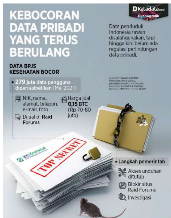
Gambar 1.4 Kebocoran Data Pribadi BPJS Kesehatan

Salah satu permasalahan besar dalam digitalisasi adalah masalah keamanan data, hal ini menjadi aspek penting dalam Manajemen Keamanan Informasi. Permasalahan keamanan ini juga menjadi perhatian besar bagi institusi pelayanan kesehatan, khususnya rumah sakit yang cukup rentan terhadap cybercrime . Fenomena kebocoran data pribadi penduduk Indonesia terbesar terjadi pada Tahun 2021. Sebanyak 279 juta data pengguna BPJS Kesehatan bocor pada pertengahan Bulan Mei 2021 seperti pada Gambar 1.4.