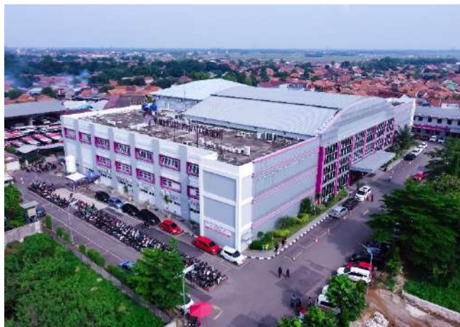
Gambar 1.1 Rumah Sakit Permata Cirebon

Rumah Sakit dalam UU Nomor 17 Tahun 2023 adalah fasilitas pelayanan kesehatan yang melakukan aktivitas layanan kesehatan individu secara paripurna baik melalui pelayanan kesehatan promotif, preventif, kuratif, rehabilitatif, dan/atau dengan menyediakan pelayanan rawat inap, rawat jalan, dan gawat darurat. Dalam Undang-Undang yang sama Pasal 4 Ayat 1 huruf c dijelaskan bahwasannya setiap orang memiliki hak untuk mendapatkan pelayanan kesehatan yang aman, bermutu, dan terjangkau agar dapat mewujudkan derajat Kesehatan yang setinggi-tingginya di Indonesia. Dalam lingkup rumah sakit, Undang-Undang juga menjelaskan kewajiban rumah sakit dalam memberikan pelayanan kesehatan yang aman, bermutu, dan efektif dengan mengutamakan kepentingan pasien sesuai standar pelayanan rumah sakit dalam Pasal 189 Ayat 1 huruf b yang berlaku.