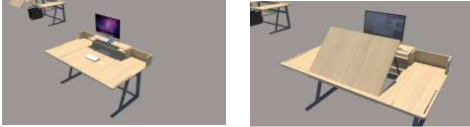
(gambar 3) sketsa final