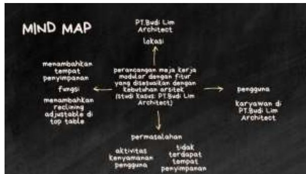
(gambar 1) mind map