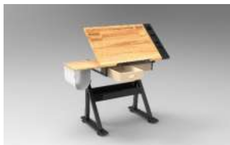
(gambar 3) sketsa alternatif