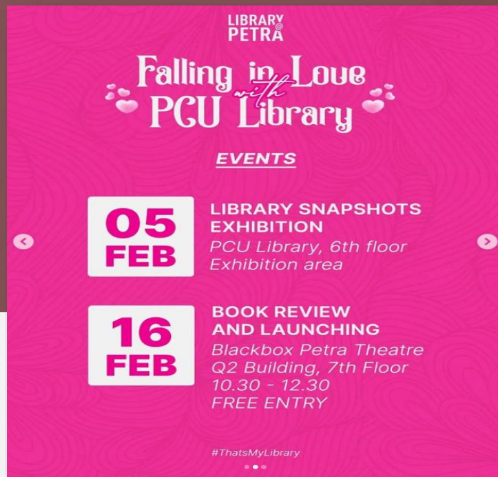
Pameran, Book Review, Lomba Foto, Festival Film

Program literasi PCU Library tidak hanya diperuntukan bagi sivitas PCU saja, namun juga banyak melibatkan warga sekitar kampus PCU dan masyarakat Surabaya. Program literasi yang dijalankan menunjukkan eksistensi PCU Library sebagai Perpustakaan Perguruan Tinggi yang inklusif