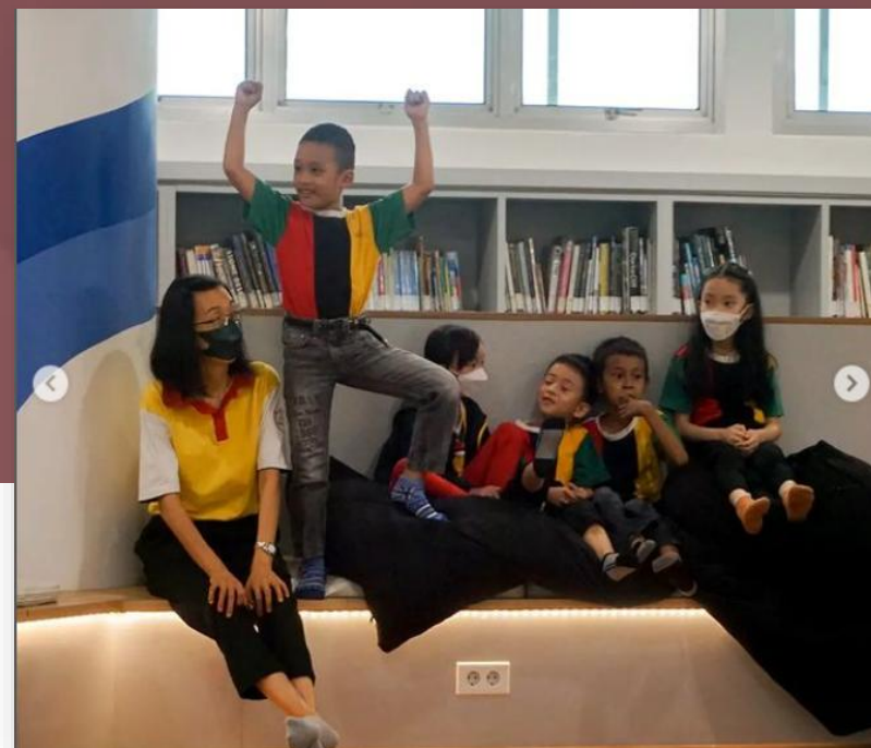
Pojok Literasi Anak dan Bunda PAUD