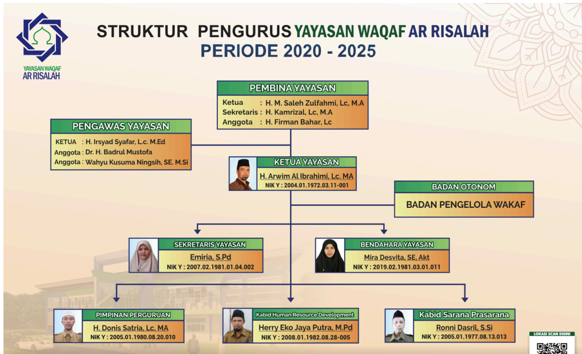
Gambar 1.3 Struktur Organisasi Yayasan Waqaf Ar-Risalah