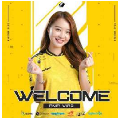
Gambar 1. 4 NitaVior Brand Ambassador ONIC Esports