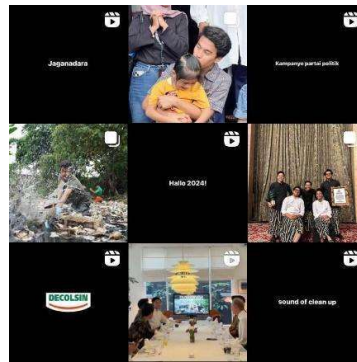
Gambar 1.1 Konten Akun Instagram @pandawaragroup

Pandawara Group memiliki tampilan konten yang lebih sederhana dibandingkan dua organisasi sebelumnya. Pengikut yang dimiliki di akun media sosial Instagram @pandawaragroup sendiri mencapai 2,4 juta. Berbeda dengan kedua organisasi sebelumnya, Pandawara Group tidak hanya berfokus kepada kampanye dan edukasi melainkan aktivitas atau kegiatan terjun langsung untuk menanggulangi dan mengurangi kerusakan lingkungan. Salah satunya adalah dengan membersihkan sungai dari tumpukan sampah.