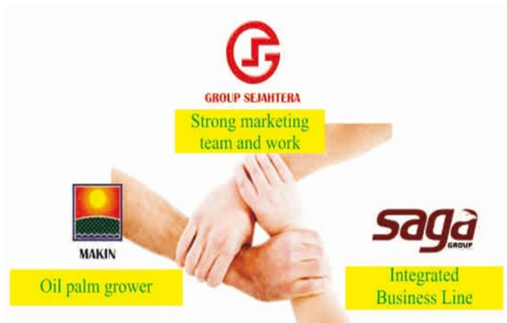
Gambar 1.1 Lini Bisnis PT. Hanampi Sejahtera Kahuripan

Gambar 1.1 di bawah ini menunjukkan lini bisnis PT. Hanampi Sejahtera Kahuripan: