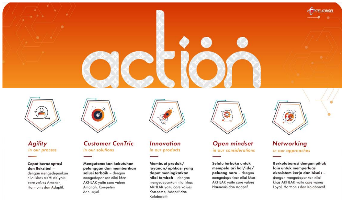
Gambar 1.4. ACTION Telkomsel