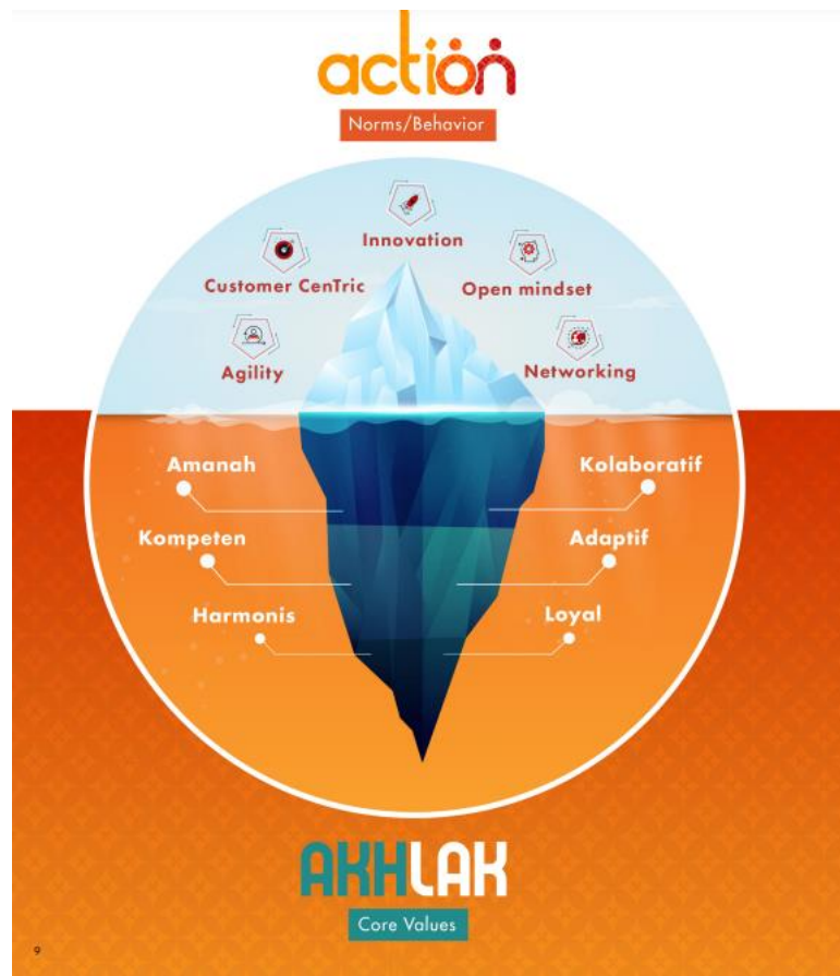
Gambar 1.3. Telkomsel Digilife Action