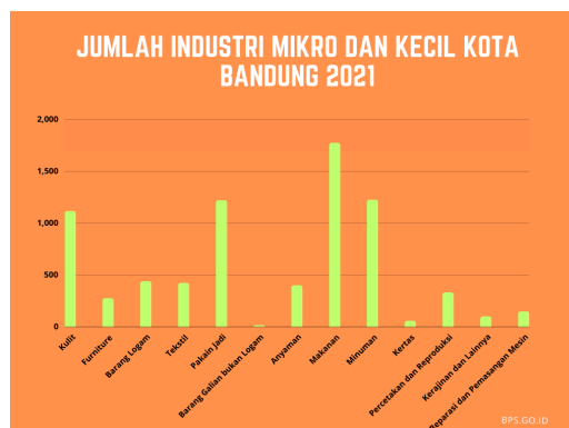
Gambar I.2 Jumlah Industri Mikro dan Kecil Kota Bandung 2021

Menurut artikel presidenri.go.id (Prabowo, 2018), tercatat ada 56 juta pelaku UMKM dan sebanyak 70% diantaranya adalah UMKM sektor makanan dan minuman. UMKM Dapurbeta merupakan salah satu dari UMKM tersebut. UMKM Dapurbeta merupakan salah satu UMKM jenis usaha mikro dengan penjualan per tahunnya yang mencapai 1,6 miliar rupiah.