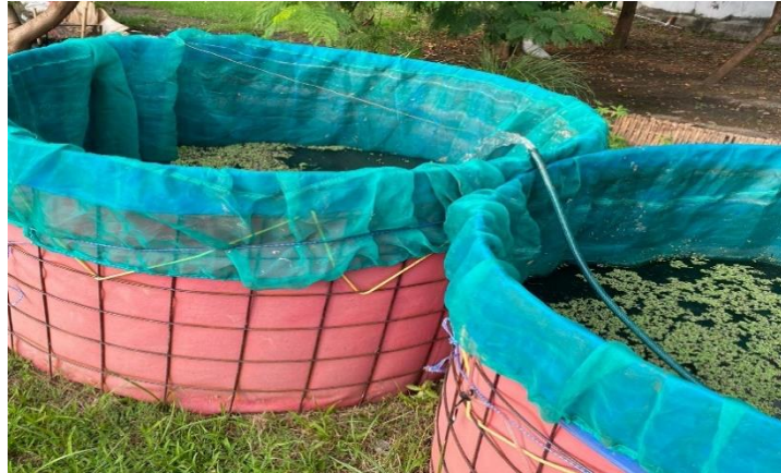
Gambar 1. 3 Kolam Bioflok PT.Helmi Farm Mandiri

PT.Helmi Farm Mandiri memiliki alamat resmi di Jl. Adhyaksa VII No. 3, Sukapura, Dayeuhkolot, Bandung. Mereka fokus pada pengembangan budidaya ikan air tawar, terutama lele, baik dalam media bioflok maupun semi bioflok. Pendekatan budidaya ini dilakukan dengan metode manual dan modern. Mereka telah membina sebanyak 200 kolam ikan lele dan kolam ikan nila dengan melibatkan 70 Anggota dalam suatu kluster, dan mereka juga mendorong partisipasi masyarakat dalam upaya mengembangkan ketahanan pangan [10]. Pendekatan budidaya yang diterapkan didasarkan pada konsep swadaya dengan prinsip gotong royong dan kerjasama yang erat antara pemerintah desa dan masyarakat lokal. Tujuannya adalah menciptakan ekosistem ekonomi yang berkelanjutan yang akan membantu memajukan masyarakat di tingkat nasional.