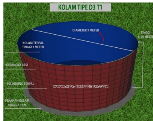
Gambar 1. 2 Kolam terpal T:1m, D: 3m [9]

Dilihat dari ukuran yang ditampilkan pada gambar 1.1, 1.2 kami akan menggunakan ukuran kolam pada gambar 1.1 karena sesuai dengan kebutuhan konsumen.