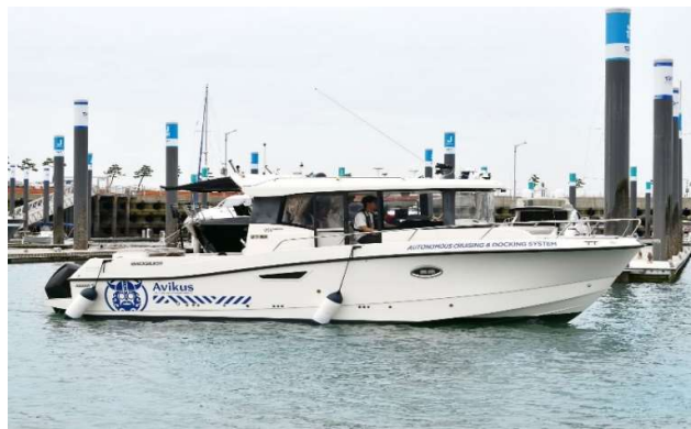
Gambar 1. 1 Avikus by HHI Group[25]

Berdasarkan teknologi yang akan digunakan, perlu adanya mikrokomputer mutakhir yang memiliki spesifikasi 128 core CUDA , memiliki CPU ( Central Processing Unit ) quad core ARM A57 agar bisa melakukan pemrosesan AI dan computer vision , kompatibel dengan pemrograman YOLO, MXnet, Caffe, Pytorch, dan lain-lain, hingga dilengkapi dengan konektivitas WiFi dan dihubungkan dengan alat penangkap citra untuk melakukan pengambilan gambar[14].