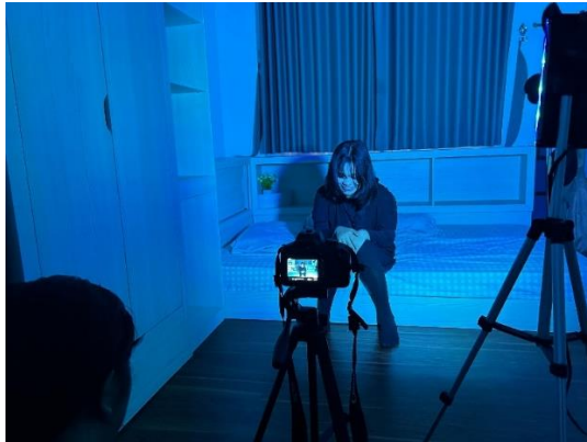
Gambar 5. Syuting Act 3