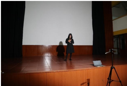
Gambar 4. Syuting Act 1 & 3

Pelaksanaan syuting Act 1 & 3 : Superiority & Courage