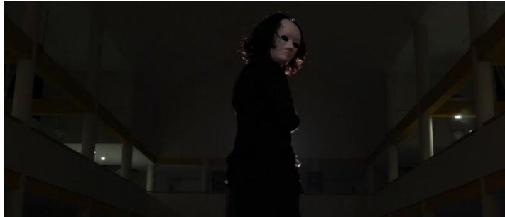
Gambar 7. Scene 1 : "Thoughts" Introduction