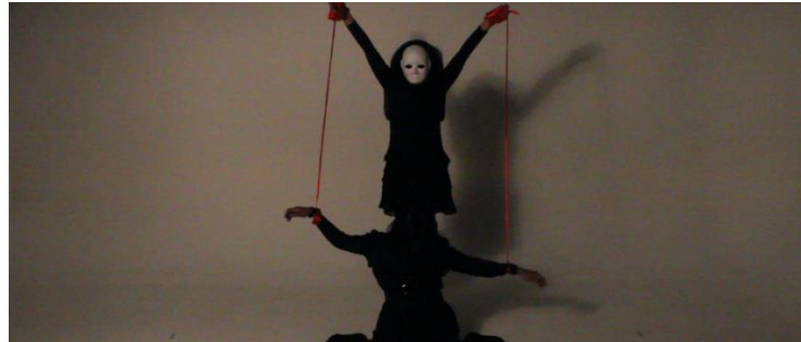
Gambar 10. Scene 9 : "Thoughts" Ribbon Dance

Adegan selanjutnya, Karakter "I" sudah terduduk lesu, pada tahap ini karakter "I" sudah kehilangan motivasi hampir seluruhnya. karakter "Thoughts" kembali dimunculkan pada adegan ini sebagai penggambaran atas apa yang dirasakan karakter "I" dengan inferiority complex nya. karakter "Thoughts" kembali menari dengan tali berwarna merah yang mengikat kepada "I" menariknya bagaikan boneka, warna merah digunakan sebagai simbolisasi bahwa ikatan antara dua karakter ini merupakan hal yang penting dan vital, penampilan tari dengan tali ini merupakan penggambaran bahwa rasa superioritas merupakan penggerak kita dalam berkehidupan.