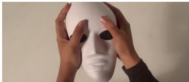
Gambar 12. Scene 16 : Destroying the Mask

paksaan dan tarikan dari keinginannya terhadap perasaan superioritas, pada film ini ditampilkan adegan "I" memotong tali yang mengikatnya dengan "Thoughts" tali tersebut menyimbolkan keinginan dari "I" untuk terus mencoba dan bergerak menjadi dirinya yang superior namun karena "Thoughts" pada akhirnya hanya menyakitinya dia tidak memiliki pilihan lain selain memutuskan tali harapan tersebut dan melihat "Thoughts" yang merupakan manifestasi dari self-idealnya mati begitu saja di hadapannya.