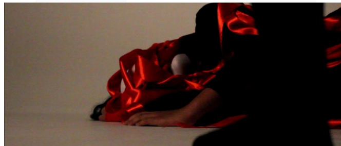
Gambar 11. Scene 15 : Death of "Thoughts"

Adegan selanjutnya, Karakter "I" sudah terduduk lesu, pada tahap ini karakter "I" sudah kehilangan motivasi hampir seluruhnya. karakter "Thoughts" kembali dimunculkan pada adegan ini sebagai penggambaran atas apa yang dirasakan karakter "I" dengan inferiority complex nya. karakter "Thoughts" kembali menari dengan tali berwarna merah yang mengikat kepada "I" menariknya bagaikan boneka, warna merah digunakan sebagai simbolisasi bahwa ikatan antara dua karakter ini merupakan hal yang penting dan vital, penampilan tari dengan tali ini merupakan penggambaran bahwa rasa superioritas merupakan penggerak kita dalam berkehidupan.