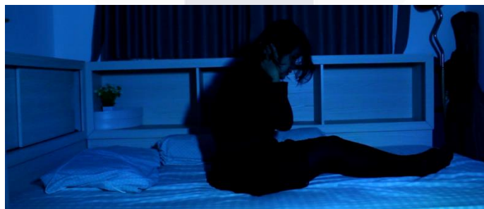
Gambar 14. Scene 17 : "I" and the emptiness

Babak ini diakhiri dengan "I" yang mengambil topeng dari "Thoughts" kemudian meremuknya, adegan ini merupakan penanda bahwa "I" yang telah dikonsumsi rasa inferioritas nya lebih memilih untuk menghilangkan keinginannya akan self-ideal sepenuhnya agar perasaan superioritas tidak lagi menyeretnya dalam kesengsaraan terhadap kesadaran bahwa dia akan selalu memiliki kekurangan dan tidak akan pernah menjadi sempurna seperti yang ia inginkan.