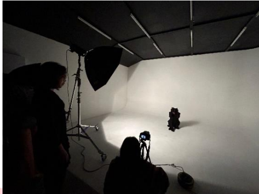
Gambar 3. Syuting Act 2