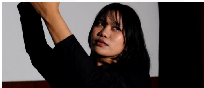
Gambar 17. Scene 22 : "I" back at the Stage

Dari rasa penyesalan "I" kembali bangkit walau tanpa tujuan dan motivasi yang jelas "I" mengikuti nalurinya untuk kembali bergerak, memaksa dirinya bergerak dengan alunan lagu yang samar-samar "I" berusaha menemukan kembali dirinya, walau dengan kekurangannya dan ketidak sempurnaannya "I" ingin merasakan kembali menjadi hidup, adegan ini merupakan bagian dari penggambaran self-acceptance dimana karakter "I" mulai menerima dirinya yang penuh kekurangan agar dia dapat memulai kembali dan menjadi lebih baik.