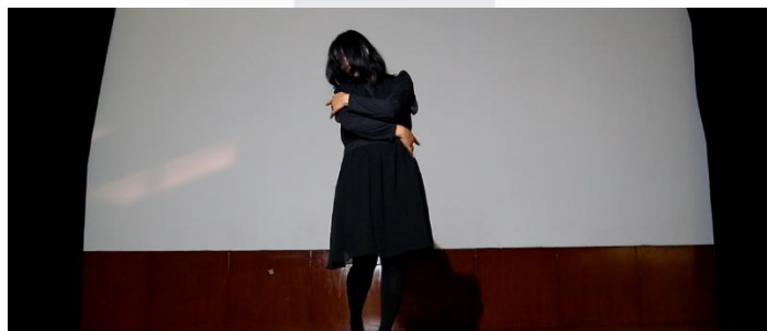
Gambar 8. Scene 3 : "I" Introduction

Pada Act 1: Superiority ditampilkan karakter "Thoughts", "Thoughts" merupakan penggambaran dari self-ideal atau Superioritas, Karakter "Thoughts" menampilkan tarian dengan tempo yang cepat, gerakan yang dibawakan terkesan luas, tegas dan percaya diri, pembawaan tarian ini menunjukkan bahwa karakter "Thoughts" merupakan karakter yang ideal, seseorang yang percaya diri akan kemampuannya, dan dapat menampilkan dirinya di atas panggung, namun dalam penampakannya karakter "Thoughts" tidak menunjukkan wajahnya melainkan mengenakan topeng putih dengan mata yang kosong, Topeng yang dikenakan karakter "Thoughts" merupakan sebuah simbolisasi bahwa karakter "Thoughts" bukan lah karakter sesungguhnya, "Thoughts" hanyalah bentuk manifestasi pikiran dari karakter "I" yang mendambakan bentuk ideal dari dirinya, maka dari itu ditampilkan adegan Transisi dari karakter "Thoughts" ke karakter "I" yang nampak serupa namun sama sekali berbeda dari pergerakannya di atas panggung.