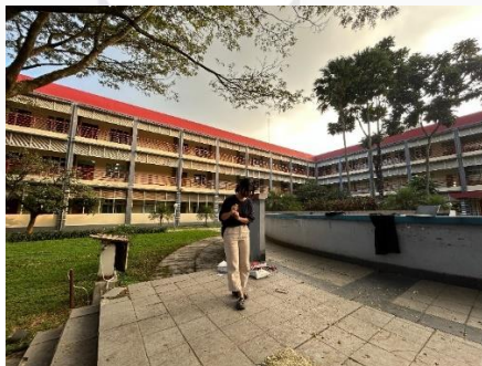
Gambar 2. Uji Coba Koreo