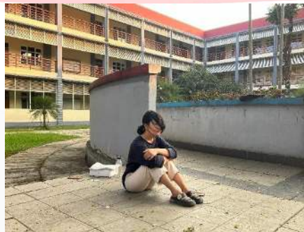
Gambar 1. Uji Coba Koreo

Tarian kontemporer yang dibawakan dilakukan secara improvisasi, pemeran diarahkan mengenai ekspresi yang akan ditampilkan sesuai dengan konsep, sehingga dilakukan beberapa uji coba koreografi untuk melihat cara pemeran mengekspresikan perasaan dari Inferiority Complex .