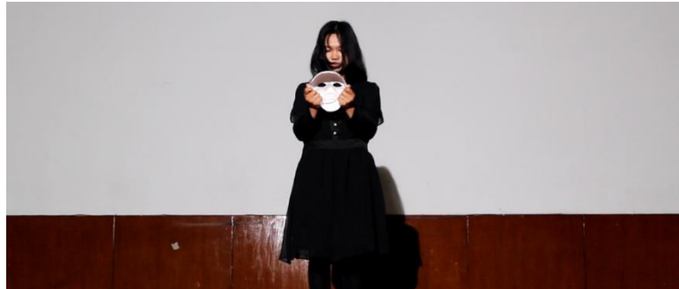
Gambar 18. Scene 24 : "I" and the Mask

dikemudiannya, penampilan tari yang lembut namun penuh emosi dibawakan oleh "I" yang telah berdamai dengan dirinya.