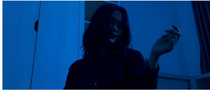
Gambar 16. Scene 20 : "I" and self - acceptance

Dari rasa penyesalan "I" kembali bangkit walau tanpa tujuan dan motivasi yang jelas "I" mengikuti nalurinya untuk kembali bergerak, memaksa dirinya bergerak dengan alunan lagu yang samar-samar "I" berusaha menemukan kembali dirinya, walau dengan kekurangannya dan ketidak sempurnaannya "I" ingin merasakan kembali menjadi hidup, adegan ini merupakan bagian dari penggambaran self-acceptance dimana karakter "I" mulai menerima dirinya yang penuh kekurangan agar dia dapat memulai kembali dan menjadi lebih baik.