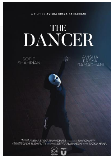
Gambar 6. Poster "The Dancer"