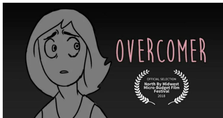
Gambar 1. 1 Overcomer