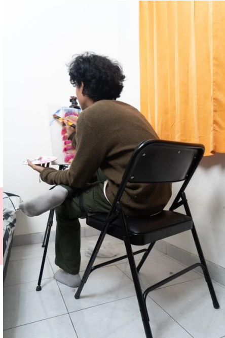
Gambar 3. Aset foto buat digital imaging

Berikut merupakan aset untuk digital imaging