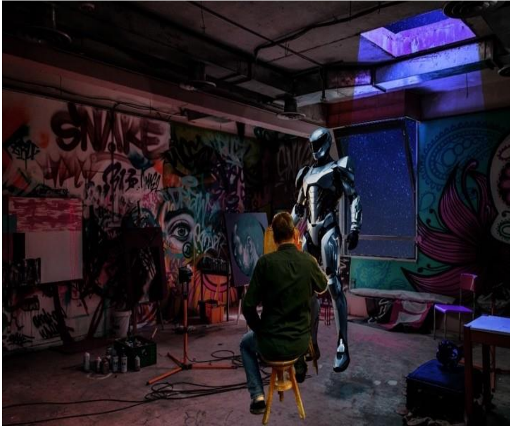
Gambar 2. Sketsa/Prototype

Berikut merupakan hasil dari foto yang penulis ambil untuk dijadikan sebagai asset untuk membuat karya digital imaging .