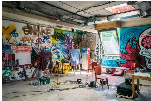
Gambar 4. Aset digital

Berikut merupakan aset untuk digital imaging