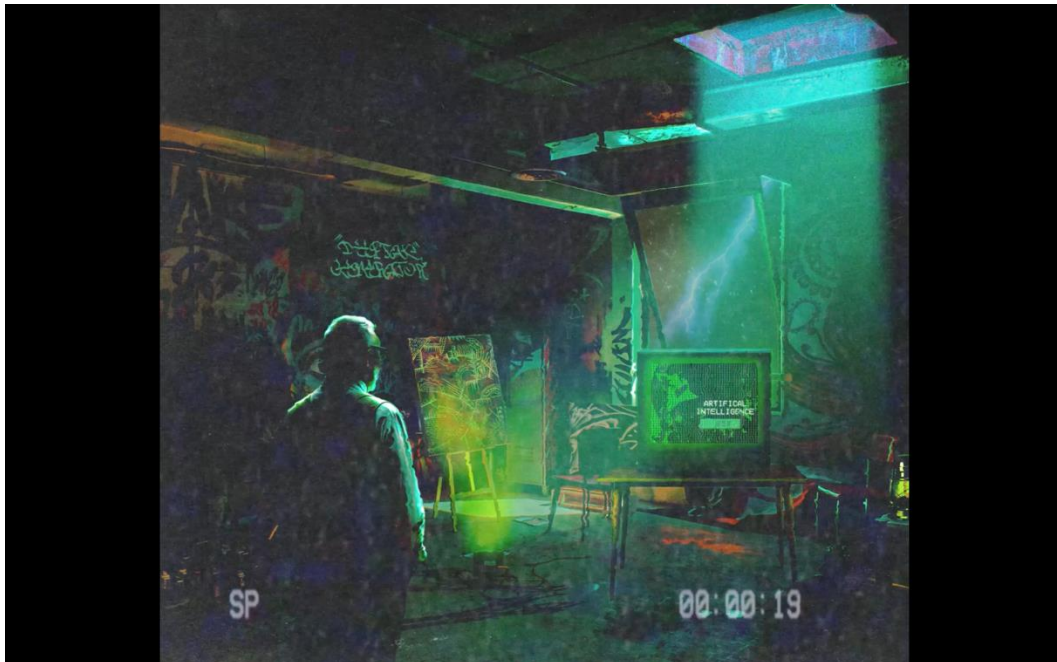
Gambar 5. Hasil proses Digital Imaging

Berikut adalah hasil dari proses pembuatan karya yang penulis buat melalui digital imaging . AI sangat membantu seniman dalam proses berkarya dalam menciptakan proses dan keutuhan karya yang akan dibuat. Dengan adanya AI, Seniman dibantu sebagai alat dan penunjang karya para seniman yang mengalami artblock atau kesusahan dalam mengembangkan karyanya.