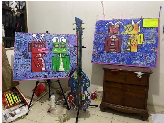
Gambar 4. Karya final Beatlee Bassman

penafsiran hubungan antara warna dan emosi bisa berbeda-beda bergantung pada perspektif individu serta konteks musik atau karya seni yang ingin diungkapkan, namun dengan mendalami keterkaitan antara warna dan emosi, penulis mampu menghasilkan karya- karya yang lebih ekspresif dan menyentuh perasaan audiens , atau penikmat seni.