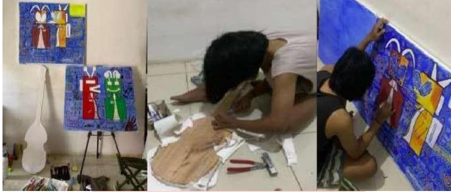
Gambar 2. Eksekusi Sketsa Karya

Langkah pertama, penulis, membuat sketsa pada sketchbook sebagai panduan untuk media objek, dan penataan karya Seni Lukis.