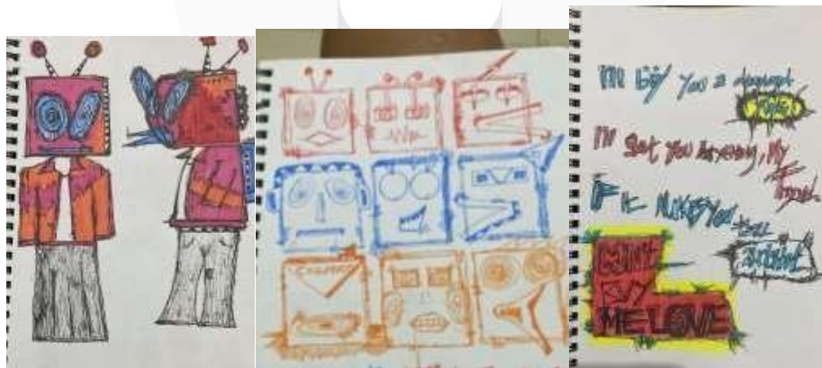
Gambar 1. Sketsa Karya

tekstur warna mulai dari warna-warna cerah hingga tampilan gelap pada setiap goresan lukisan. Perpaduan warna-warna yang dihasilkan dari spidol, krayon, cat akrilik dan pilox, serta elemen kata-kata dan simbol akan menjadikan karya ini sebagai representasi menarik dari ekspresi emosional yang mengaitkan musik dengan goresan kuas. Pemilihan warna yang tepat dapat memperkuat visualisasi emosi yang ingin disampaikan melalui musik. Warna-warna cerah seperti kuning dan merah mencerminkan kegembiraan dan semangat. Sebaliknya, warna-warna redup seperti biru dan abu-abu menggambarkan suasana melankolis dan murung. Warna putih dapat melambangkan kekakuan dan isolasi, sementara warna gelap seperti hitam dan hijau tua membawa nuansa tegang dan misterius. Untuk menyampaikan kesan romantis dan kelembutan, warna-warna seperti merah delima dan ungu lembut dapat menjadi pilihan yang tepat. Meski penafsiran hubungan antara warna dan emosi bisa berbeda-beda bergantung pada perspektif individu serta konteks musik atau karya seni yang ingin diungkapkan, namun dengan mendalami keterkaitan antara warna dan emosi, penulis mampu menghasilkan karya-karya yang lebih ekspresif dan menyentuh perasaan audiens atau penikmat seni.