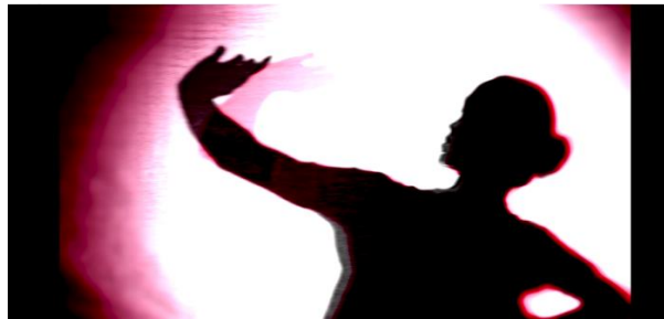
Gambar 2: Gerakan "Nyawang" Tari Puja

yang putih menjadi bagian Pada karya ini, sehingga ketika karya ini ditampilkan maka set yang ditampilkan seperti gambar yang ada. Pada karya ini juga menampilkan beberapa gerakan tari yang menjadi representasi dari androgini.