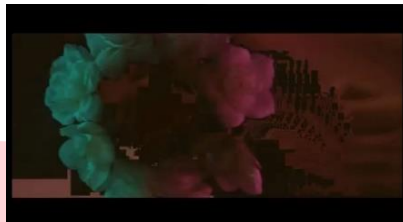
Gambar 7 Teknik Data Mosh

Data Mosh merupakan sebuah Teknik editing yang akan merusak video menjadi pecah pecah, Teknik ini digunakan sebagai konsep visual untuk merepresentasikan androgini. Data Mosh digunakan sebagai pengartian salah paham Masyarakat terhadap androgini.