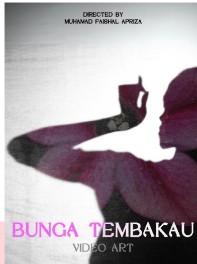
Gambar 12: Poster karya

Link Karya: https://youtu.be/Kph6qZ4YAyU