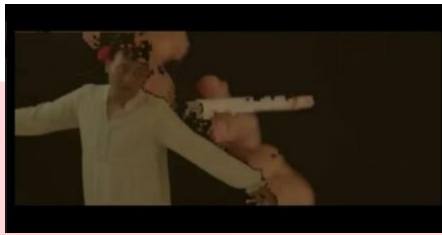
Gambar 4: Penari Laki - Laki

Penari laki laki digunakan sebagai konsep visual sebagai representasi dari androgini. Penari laki laki juga dipilih karena mempunyai karakter yang kuat terhadap androgini.