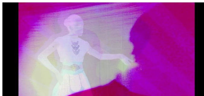
Gambar 3: Gerakan "Pugeran" Tari Puja

Pada gambar 14 nampak gerakan "Nyawang" dari tari Puja yang menunjukkan kelembutan serta gerakan tangan yang halus, gerakan ini merupakan representasi dari feminim yang cenderung lembut.