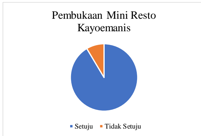
Gambar I. 2 Kuesioner Pembukaan Mini resto Kayoemanis

Berdasarkan hasil survei yang dilakukan, dijelaskan bahwa dari 35 responden terdapat 91.42% atau sebanyak 32 responden setuju bila Kayoemanis membuka mini resto . Sedangkan 8.58% sisanya atau sebanyak 3 responden tidak setuju bila Kayoemanis membuka mini resto . Dengan membuka mini resto , maka pelanggan dapat melakukan dine in sehingga kualitas dimsum terjaga saat sampai ke tangan pelanggan, daya tampung akan semakin besar sehingga tidak ada lagi pelanggan yang tidak kebagian kuota PO karena pelanggan dapat langsung ke mini resto untuk memesan sehingga tidak ada biaya ongkos kirim. Pelanggan Kayoemanis saat ini didominasi oleh penghuni kompleks perumahan BBS 3 dengan pembelian dimsum sebanyak dua kali dalam sebulan. Penjualan setiap bulannya didominasi oleh jenis dimsum original dan dimsum mentai.