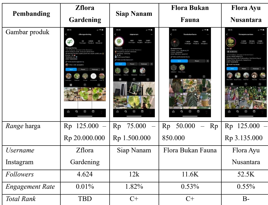
Tabel I. 2 Perbandingan Zflora Gardening dengan Kompetitor

Berdasarkan tabel di atas dapat diketahui terdapat perbedaan antara Zflora Gardening dengan ketiga kompetitornya yaitu Siap Nanam, Flora Bukan Fauna, dan Flora Ayu Nusantara, diketahui bahwa jumlah followers , engagement rate , dan total rank yang diperoleh dari socialblade relatif rendah dibandingkan dengan ketiga kompetitornya.