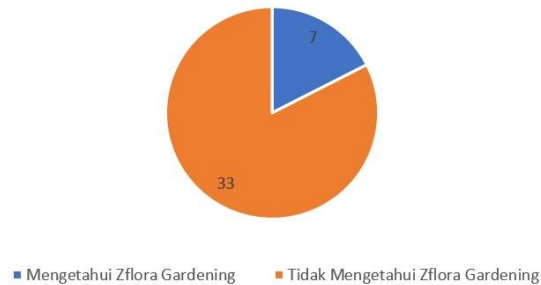
Gambar I. 2 Brand awareness Zflora Gardening

tanaman indoor, pinggiran kota dengan lahan lebih luas, hingga pedesaan dengan akses ke lahan besar.