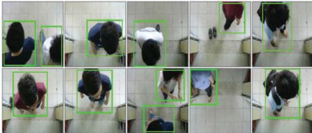
Gambar 1.3 Berbagai Sampel Data Sistem People Counting Berbasis Visual [8]

menangkap gambar atau video bagian atas kepala pengunjung, kemudian merancang sebuah mekanisme deep learning yang dapat memprediksi arah gerakan orang tersebut berdasarkan data per frame pengambilan gambar [8]. Pada proses training -nya, sistem ini menghasilkan mean Average Precision (mAP) mendekati 70% dan angka tersebut mencapai 83% ketika telah melewati proses fine-tuning selama 10 jam [8].