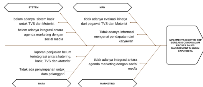
Gambar I. 2. Fishbone Diagram proses sales management di UMKM Dapurbeta. (Tantri, S. F et al.,2024)

UMKM Dapurbeta merupakan sebuah restoran yang berdiri sejak tahun 2020. Dapurbeta sendiri bergerak di bidang Food & Beverages yang menjadikan makanan khas nusantara sebagai ciri khas dari Dapurbeta. Dapurbeta memiliki keunikan yang berbeda dengan UMKM lainnya yaitu, Dapurbeta secara rutin mengganti menunya setiap 1 bulan sekali. Pemilihan menu ini berasal dari hasil penjualan pada bulan sebelumnya, menu yang terjual laris akan dipertahankan dan yang kurang laris akan digantikan oleh menu baru.