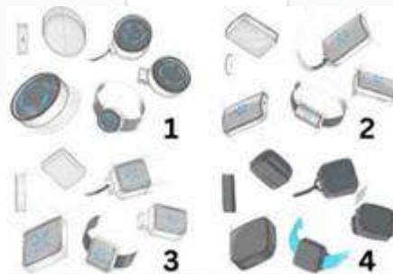
Gambar 3 Sketsa alternatif

sketsa alternatif dari peroduk yang dibuat berjumlah empat sketsa dan satu sketsa terpilih. Pemilihan sketsa ditentukan oleh orang dengan demensia alzheimer agar dapat sesuai dengan preferensi dari orang dengan demensia alzheimer. Produk yang dipilih berwarna gelap dikarenakan orang dengan demensia alzheimer ini tidak ingin terlalu mencolok.