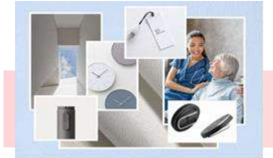
Gambar 2 Moodboard

merasa terganggu dengan berat produk. Produk dapat di- customize menjadi berbagai wearable device seperti baju, kalung, gelang dan juga ikat pinggang. Hal ini berguna untuk menyesuaikan kegiatan dan kebiasaan dari orang dengan demensia alzheimer. Lalu kesan, estetika, atau suasana yang ingin disampaikan pada produk ini adalah ketenangan dan kesederhanaan.