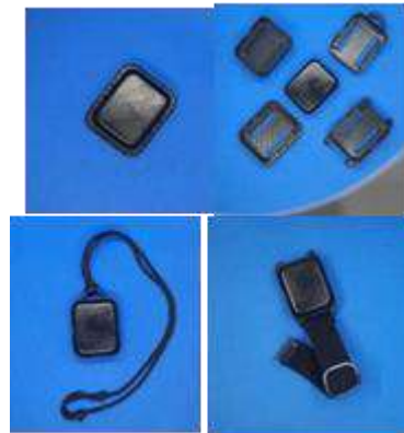
Gambar 5 Hasil akhir prototype