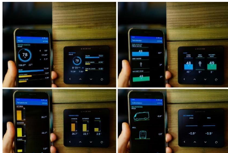
Gambar 1. 1 Pemantauan baterai menggunakan aplikasi

Gambar 1.1 dan 1.2 merupakan monitoring pada Stasiun Pengisian Baterai Kendaraan Listrik Umum (SPBKLU) dengan konsep " battery swap ", tetapi jika dilihat Fitur-fitur yang ada di spbklu yang tersedia saat ini belum ada fitur monitoring State Of Health (SOH). Hal itu membuat pengguna saat ini tidak bisa melihat informasi lebih lengkap seperti SOH. Selain itu juga pengguna tidak bisa memperkirakan usia dan kesehatan pada baterai yang digunakan. Hal itu membuat risiko kerusakan ataupun kegagalan pada sistem baterai lebih besar. Saat ini belum kami temukan SPBKLU yang memiliki fitur monitoring prediksi kesehatan dan usia baterai yang dapat di akses oleh pengguna secara langsung.