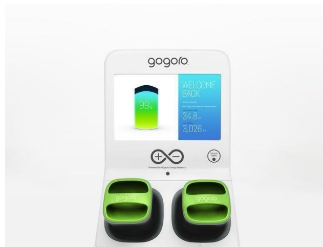
Gambar 1. 2 Pemantauan status baterai pada SPBKLU

Dikutip dari www.omazaki.co.id , jenis baterai untuk mobil listrik paling banyak diaplikasikan adalah baterai Li-ion. Baterai ini mungkin sudah tidak asing lagi bagi kita karena juga digunakan di banyak peralatan elektronik portabel seperti ponsel dan laptop. Perbedaan utama adalah soal skala. Kapasitas dan ukuran fisiknya ini pada mobil listrik jauh lebih besar ini sering disebut sebagai traction battery pack .