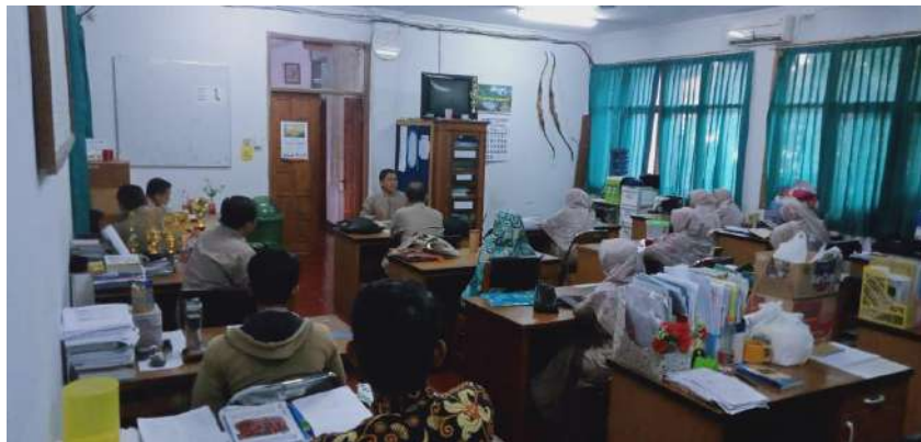
Gambar 1. 4 Dokumentasi Kegiatan Refleksi

Selain kegiatan knowledge sharing dari Yayasan, kegiatan knowledge sharing yang dilakukan diluar program atau yang diadakan oleh pihak eksternal juga diikuti oleh karyawan yayasan. Kegiatan eksternal yang diikuti yaitu seperti workshop, seminar, dan pelatihan yang hanya diikuti oleh perwakilan karyawan dari LPI yayasan Al-Muttaqin. Karyawan yang menjadi perwakilan mengikuti kegiatan diluar akan berbagi pengetahuan kepada rekan kerjanya. Tujuannya untuk berbagi informasi dan pengetahuan yang telah di ikuti rekan-rekan kerja. Kegiatan Refleksi terjadi seperti gambar berikut: