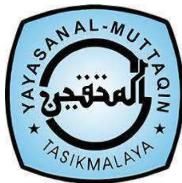
Gambar 1. 1 Logo LPI Yayasan Al-Muttaqin

Selain fokus pada Lembaga Pendidikan Islam (LPI), yayasan jua mendukung lembaga lain seperti Lembaga Ekonomi Islam (LEI), Lembaga Kesehatan, Lembaga Sosial Islam (LSI) dan Lembaga Dakwah Islam (LDI). LPI Yayasan Al-muttaqin ini juga mengelola organisasi dan pesantren. Salah satu keunggulan pendidikan yang diberikan LPI Yayasan Al-Muttaqin khususnya pada tingkat SD, SMP, dan SMA adalah diterapkannya sistem KBM (kegiatan belajar mengajar) dengan pola “ Full day school ”. Pendekatan ini bertujuan untuk membekali peserta didik dengan pendidikan yang komprehensif dan menciptakan generasi umat yang beriman dan bertakwa yang menguasai ilmu pengetahuan yang beriman dan bertakwa, menguasai ilmu pengetahuan dan teknologi serta menjadi generasi ulul albab. Berikut logo dari Yayasan LPI Al-Muttaqin.