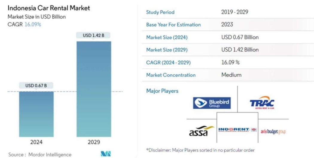
Gambar I. 1 Indonesia Car Rental Market

berusaha mengatasi kesenjangan jarak dan waktu. Manusia sangat membutuhkan transportasi karena untuk memenuhi kebutuhan hidup yang beraneka ragam, umumnya berkaitan dengan produksi barang dan jasa (M. Nur Nasution 2003: 364). Quta Rent merupakan Perusahaan yang menyediakan jasa rental mobil merupakan usaha penyewaan mobil yang saat ini melayani mahasiswa yang membutuhkan moda transportasi mobil. Usaha penyewaan mobil ini dekat dengan Telkom University berlokasi di Perumahan Permata Buah Batu Bandung.