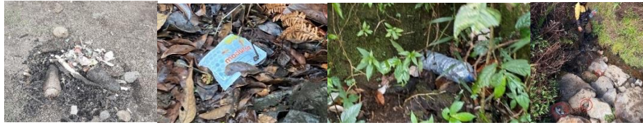
Gambar 2. Pencemaran lingkungan pada pos-pos pendakian Jalur Gunung Putri

Disetiap pos pendakian, masing-masing ditemukan sampah yang ditinggalkan pendaki walaupun sudah ada panduan, palang dan penampungan sampah sementara. Dikarenakan masing-masing pos memiliki tenda yang digunakan oleh warga sekitar sebagai tempat jualan yang menjual jajanan, pencemaran lingkungan akibat sampah yang ditinggalkan baik oleh pendaki ataupun oleh penjual jajanan akan semakin bertambah. Sampah yang paling banyak ditemukan merupakan sampah plastik bungkus camilan atau kantong plastik. Kerusakan lingkungan yang ada memiliki dampak terhadap manusia seperti pendaki, penjual, warga sekitar dan petugas balai besar, hewan serta tanaman endemik . Contohnya seperti hewan yang memakan sampah karena mengiranya sebagai makanan atau rusaknya tanah akibat sampah yang mengendap.