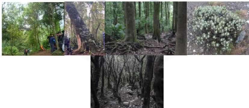
Gambar 3. Pencemaran lingkungan pada pos-pos pendakian Jalur Gunung Putri