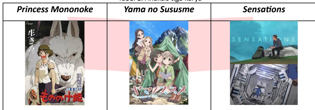
Tabel 1. Analisis tiga karya