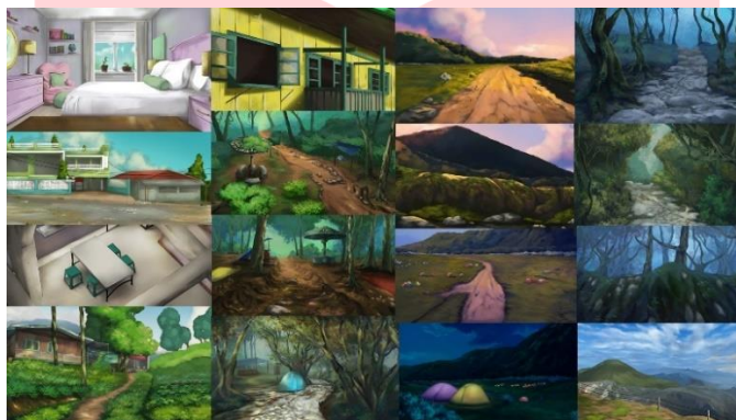
Gambar 6. Tahap Pewarnaan

Proses tahap terakhir merupakan pewarnaan yang dilakukan dengan pengayaan secara semi realis, digunakan warna-warna yang sesuai dengan mood yang ingin disampaikan pada scene tersebut. Pemberian warna diawali dengan memberikan warna dasar atau blocking warna, lalu disusul dengan pemberian detail warna terhadap objek-objek yang ada. Setelahnya diberikan pencahayaan dan bayangan terhadap objek-objek yang ada. Adapun beberapa pewarnaan background yang sudah dibuat untuk perancangan background sebagai berikut: