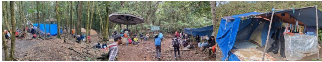
Gambar 1. Kondisi area pos pendakian Gunung Gede-Pangrango Jalur Gunung Putri

Jalur pendakian ini memiliki sebelas pos, lima utama dan enam pos bayangan. Diketahui bahwa disetiap pos pendakian yaitu lima pos utama dan enam pos bayangan, masing-masing memiliki objek-objek serta layout yang berbeda-beda di dalam areanya.