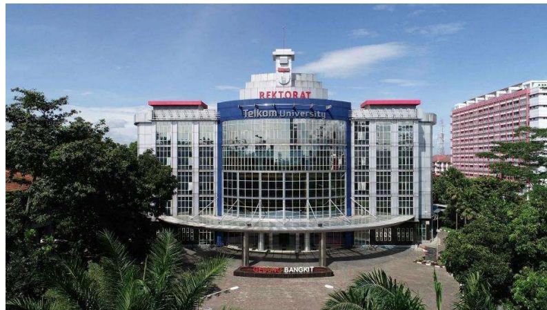
Gambar 1. 1 Gedung Bangkit Telkom University

Universitas Telkom, sebelumnya dikenal dengan Sekolah Tinggi Teknologi Telkom (STT Telkom), merupakan lembaga swasta yang berdiri sejak tahun 1990. Pada tahun 2013, Direktur Jenderal Pendidikan Tinggi Kemendikbud mengeluarkan Surat Keputusan Nomor 309/E/0/2013, penggabungan empat perguruan tinggi Telkom menjadi Universitas Telkom. Selama kurun waktu 10 tahun, Telkom University telah berhasil menjadi perguruan tinggi swasta nomor satu di Indonesia yang meraih akreditasi unggul berdasarkan keputusan BAN-PT. Telkom University memiliki dosen yang mencapai 1031 orang dan 36.898 mahasiswa (Telkom University, 2023). Selain itu, saat ini Telkom University tercatat memiliki 52 program studi yang terdiri dari 7 fakultas. Telkom University terletak di Jl. Telekomunikasi. 1, Terusan Buahbatu - Bojongsoang, Telkom University, Sukapura, Kec. Dayeuhkolot, Kabupaten Bandung, Jawa Barat.