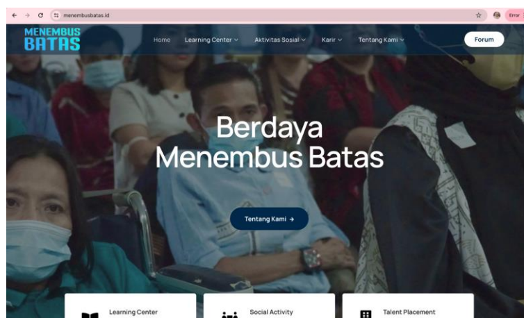
Gambar 1.1 Laman Website Menembus Batas

diberikan secara berkala dalam rentang waktu yang ditentukan oleh penyelenggara sampai akhirnya para difabel mendapatkan sertifikat tanda bahwa mereka memenuhi standar yang ditetapkan oleh Menembus Batas. Menembus Batas menggunakan platform online untuk menunjang segala bentuk pemberian informasi juga promosi, diantaranya menyediakan layanan daring berupa website yang dapat membantu memudahkan para difabel mengakses informasi dari Menembus Batas.