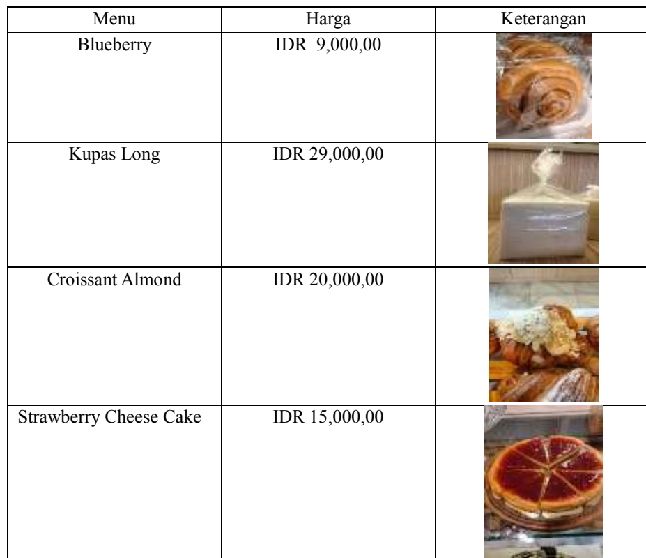
Daftar Produk Roti Panas 2024