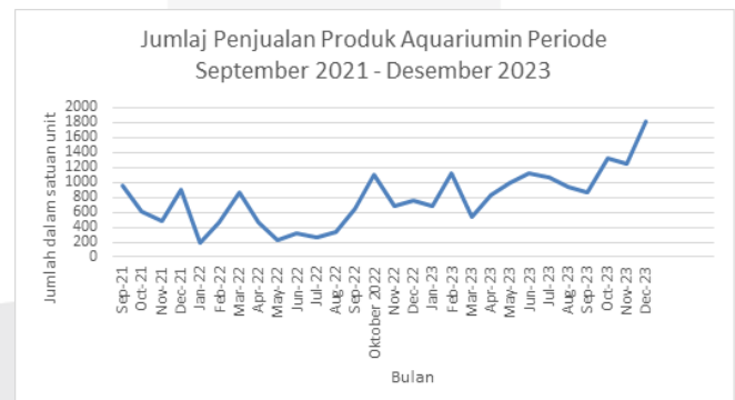
Gambar 1 Jumlah Penjualan Aquariumin

Aquariumin adalah usaha yang menawarkan produk aquascape seperti batu, pasir, kayu, dan tanaman air serta layanan pembuatan proyek aquascape untuk berbagai lokasi. Aquariumin berdiri sejak 2021. Aquariumin menarik konsumen dengan paket aquascape yang dilengkapi video tutorial pemasangan. Gambar 1 menunjukkan grafik penjualan Aquariumin yang mengalami fluktuasi di beberapa bulan dengan tren kenaikan tahunan rata-rata penjualan sebesar 1814 unit per bulan dari September 2021 hingga Desember 2023. Pemilik menganggap perlunya peningkatan penjualan, salah satunya dengan membuka toko offline , dan pernyataan tersebut juga didukung dengan hasil kuesioner yang dibagikan terhadap pelanggan Aquariumin yang hasilnya terdapat pada gambar 2.