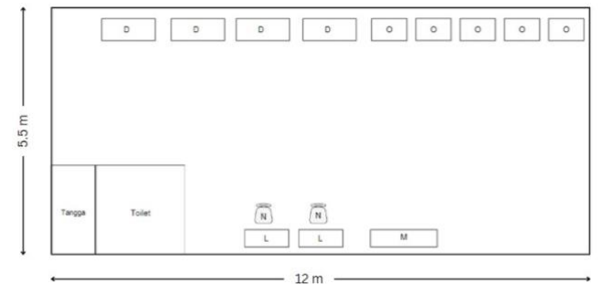
Gambar 4 Layout Lantai 2