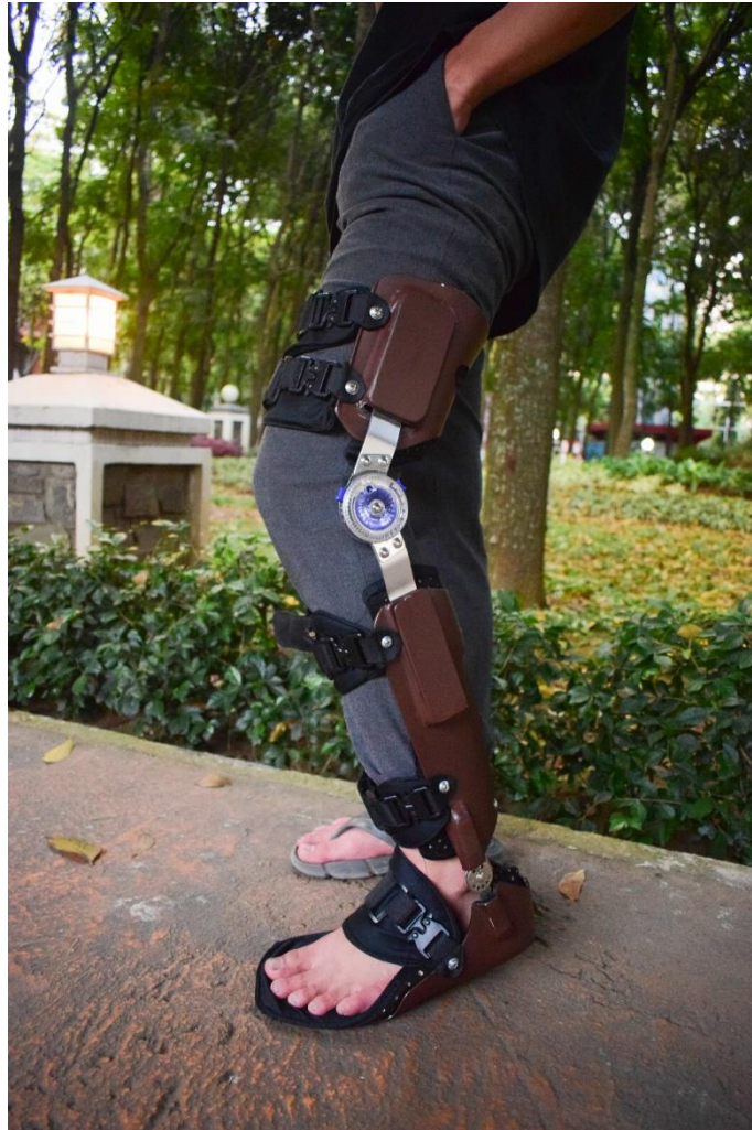
Gambar 2 Foto Purwarupa Produk sumber: dokumentasi pribadi, 2024.