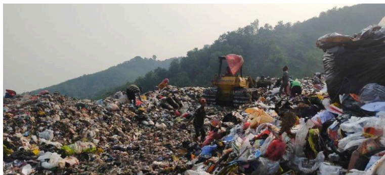
Gambar 1.1 Kondisi TPA Sarimukti yang over kapasitas

Di kota Bandung sendiri masalah sampah juga masih menjadi masalah besar yang belum dapat diselesaikan hingga saat ini. Menurut data dari (Badan Pusat Statistik Kota Bandung, 2024) jumlah total sampah yang dihasilkan kota Bandung pada tahun 2023 mencapai 1.609,76 Ton/hari. Jumlah ini jauh lebih banyak jika kita bandingkan dengan tahun 2022 yang berjumlah 1.594,18 ton per hari. Koordinator Forum Bandung Bebas Sampah (BJBS) Ria Ismaria mengatakan bahwa kondisi sampah di kota Bandung sangat memprihatinkan. Beliau menambahkan bahwa kota Bandung sudah darurat sampah sejak Mei 2023 lalu. Salah satu pemicu utamanya adalah over capacity dari TPA Sarimukti hingga lebih dari 70%. Penumpukan sampah di TPA sarimukti ini bisa terjadi dikarenakan masyarakat tidak memilah sampah yang mereka produksi setiap harinya. Lebih dari 75% sampah-sampah yang datang ke TPA Sarimukti merupakan sampah makanan, plastik dan Sampah Kertas yang seharusnya bisa didaur ulang terlebih dahulu sebelum berakhir di tempat pemrosesan akhir (TPA).