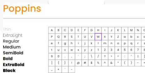
Gambar 7 Font

Tipografi yang akan digunakan adalah jenis Font Sans-Serif karena tampilannya yang bersih dan modern, cocok dengan estetika geometris. Pemilihan font sans serif juga memiliki kejelasan visual karena tidak memiliki detail yang berlebihan font ini tidak akan bertabrakan (seimbang) dengan elemen geometris dalam desain dan menonjolkan bentuk-bentuk dari elemen geometris yang ada. Penggunaan tipografi yang besar dan jelas dalam desain geometri dapat membantu menyampaikan informasi dengan cepat dan efektif, menarik perhatian remaja yang sering kali lebih suka membaca teks yang singkat dan padat.