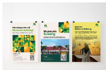
Gambar 15 Poster