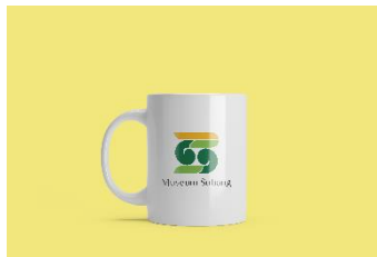
Gambar 22 Mug