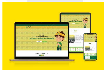
Gambar 10 Website