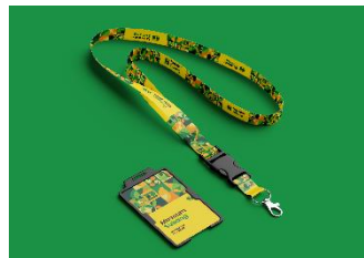
Gambar 18 Lanyard