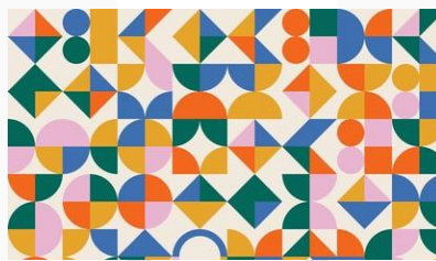
Gambar 5 Motif Batik Subang (Batik Ganasan)