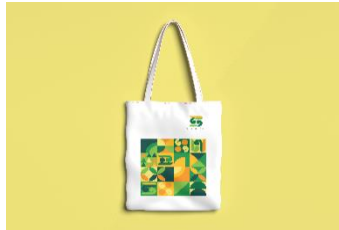
Gambar 21 Totebag