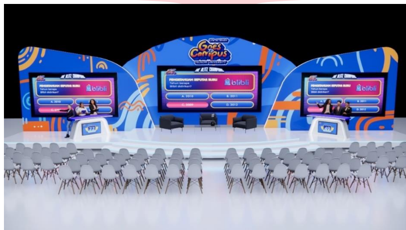
Gambar 6. Desain Stage saat Game Show

3.5 Share, Terdapat booth yang menyediakan berbagai macam merchandise dan photobooth. Untuk mendapatkan merchandise, peserta harus terlebih dahulu berfoto di photobooth dengan photoframe maskot Life at Blibli Goes To Campus yang telah disediakan.