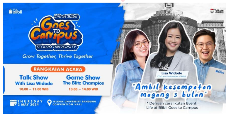
Gambar 2. Desain Billboard