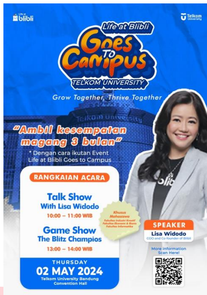
Gambar 3. Desain Poster