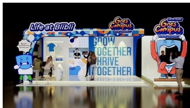
Gambar 7. Desain Stage saat Game Show

3.5 Share, Terdapat booth yang menyediakan berbagai macam merchandise dan photobooth. Untuk mendapatkan merchandise, peserta harus terlebih dahulu berfoto di photobooth dengan photoframe maskot Life at Blibli Goes To Campus yang telah disediakan.