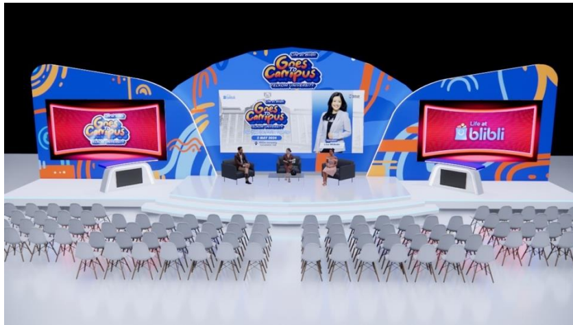
Gambar 5. Desain Stage untuk Talkshow

memiliki beberapa kategori soal, yaitu Sains, Matematika, Pengetahuan Umum, Seputar Blibli, dan Seputar Telkom University.