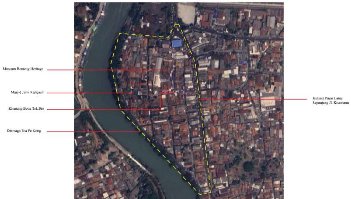
Gambar 1. 1 Peta Kawasan Pasar Lama Tangerang

Kawasan Pasar Lama Kota Tangerang memiliki berbagai potensi sebagai pusat pariwisata karena lokasinya strategis, berdekatan dengan Stasiun Tangerang yang memudahkan akses pengunjung dari berbagai daerah. Kawasan ini menjadi tempat berburu kuliner karena menyajikan berbagai pilihan makanan, baik tradisional maupun modern. Selain itu, kawasan ini menjadi bukti akulturasi budaya antara Pribumi dan Tionghoa, memiliki beberapa bangunan tua yang menyimpan nilai sejarah dan budaya tinggi, sehingga wisatawan memiliki kesempatan berkunjung untuk belajar dan merasakan atmosfer masa lalu.