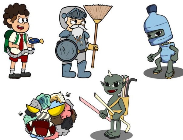
Gambar 2 Desain Karakter Game Plastic Monster Trash