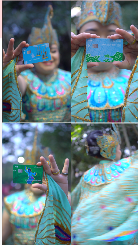
Gambar 4.12 Interest Teaser Video Edisi Kartu Debit

Video teaser pada tahapan ini penulis rancang bertujuan untuk memberikan perhatian dengan menunjukkan penari merak yang sedang menggenggam kartu debit Bank Jenius edisi Jawa Barat sambil menari, untuk memperkuat tema dari Jawa Barat. Video teaser kartu debit Bank Jenius ini diharapkan dapat menarik perhatian target audience karena dengan durasi 15 detik dengan menampilkan kartu debit Bank Jenius edisi Jawa Barat ini dapat memunculkan rasa penasaran dari target audience .