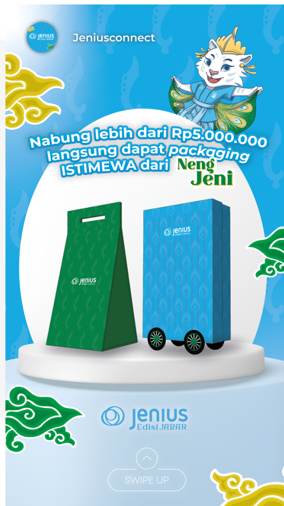
Gambar 4.24 Action Instagram Feeds Sumber : (Mudihardjo,2024)

Pada tahap action , poster digital dirancang untuk mengingatkan target audience agar membuat kartu debit Bank Jenius edisi Jawa Barat. Poster ini juga mempersuasi mereka yang awalnya tidak tertarik, dengan menekankan edisi terbatas yang hanya tersedia dari 19 hingga 31 Agustus 2024, serta mengajak mereka mengunjungi booth di mall Bank Jenius.