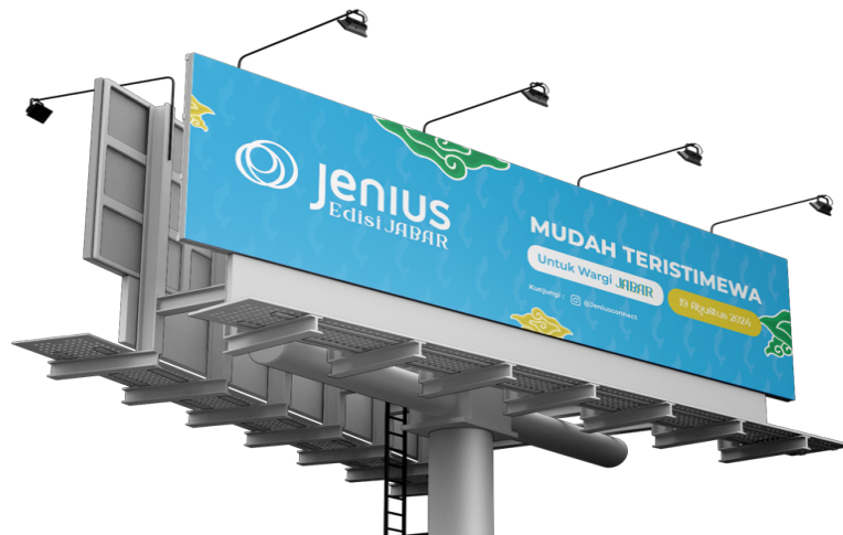
Gambar 4.8 Attention Billboard Jalan Soekarno-Hatta Bandung

Untuk memulai tahap AISAS, penulis fokus pada tahap attention dengan memilih media billboard sebagai alat utama. Billboard ini menampilkan logo Bank Jenius edisi Jawa Barat, tagline, tanggal, serta ajakan untuk mengunjungi Instagram resmi Bank Jenius. Tujuannya adalah menarik perhatian target audiens, yaitu pekerja kantoran dan mahasiswa di Bandung, agar tertarik mencari informasi lebih lanjut mengenai promosi yang ditawarkan. Pemilihan billboard didasarkan pada kebiasaan target audiens yang sering menggunakan kendaraan di jalan raya. Untuk desain, billboard dibuat dengan elemen batik megamendung dari Cirebon dan Kujang khas Jawa Barat, guna memperkuat pesan promosi edisi Jawa Barat dari Bank Jenius.