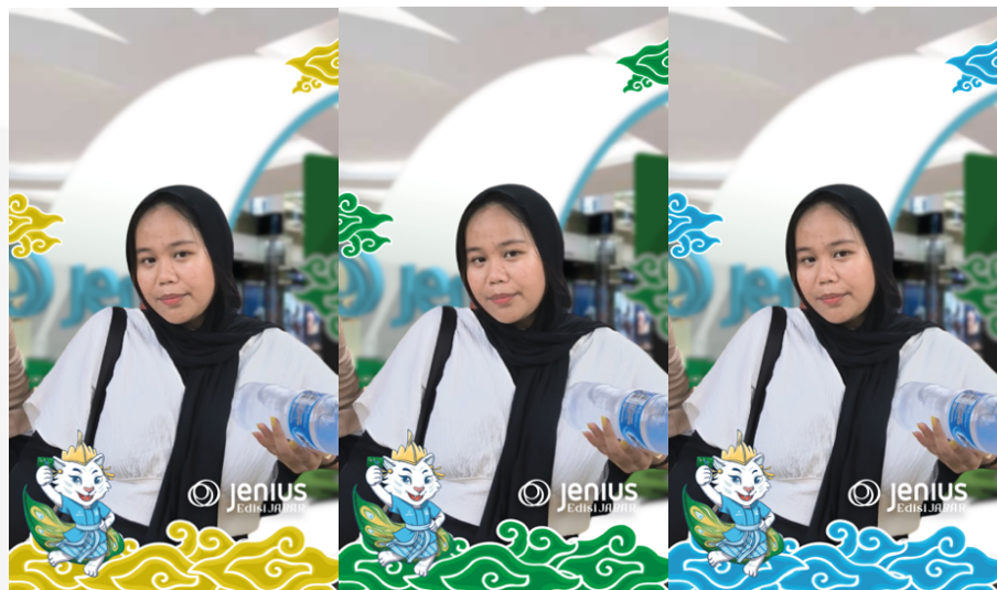
Gambar 4.23 Action Instagram Filter

Pada tahapan action ini, target audience yang ingin membuka rekening atau membuat kartu debit Bank Jenius sudah pasti mendatangi booth mall Bank Jenius, dan filter Instagram ini dapat digunakan oleh target audience yang ingin mengabadikan momen sekaligus mengunggahnya ke Instagram story dengan menggunakan filter Instagram ini. Penulis merancang desain filter dengan menggunakan 3 desain dengan warna – warna yang berbeda, yaitu kuning, hijau dan biru.