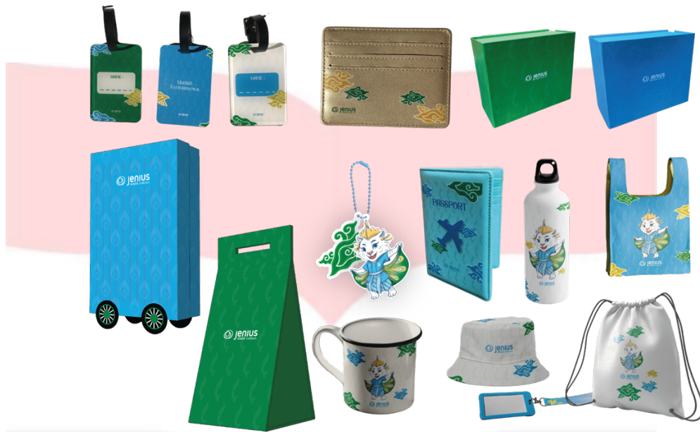
Gambar 4. 25 Share Merchandise

Tahapan terakhir pada promosi Bank Jenius edisi Jawa Barat ini yaitu dengan menggunakan merchandise sebagai media untuk menyebarkan promosi dari Bank Jenius. Alasan perancangan dari merchandise sendiri karena promosi yang dilakukan Bank Jenius pada edisi Jawa Barat ini yaitu berjangka pendek, sehingga dengan perancangan merchandise diharapkan target audience yang melihat merchandise yang digunakan oleh pengguna Bank Jenius juga dapat memberi ingatan dan exposure dari target audience yang melihat merchandise tersebut