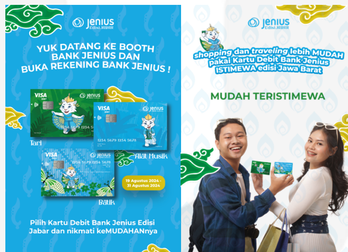
Gambar 4.20 Search Flyer Booth Mall

Tahapan search ini, selain target audience bisa mendapatkan info seputar kartu debit secara online , target audience pun dapat menemukan info terkait kartu debit Bank Jenius edisi Jawa Barat secara offline dengan cara mendapatkan flyer yang disebar oleh sales man di booth mall Bank Jenius. Isi dari flyer yang disebar yaitu mengenai informasi seputar cara mendapatkan kartu debit Bank Jenius, lalu desain dari kartu debit Bank Jenius, lalu sedikit USP dari kartu debit Bank Jenius yang dilengkapi dengan visual dari Jawa Barat dan visual dari traveler untuk memperkuat kesan Jawa Barat dan USP dari kartu debit Bank Jenius pada flyer tersebut.