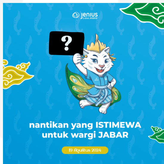
Gambar 4.9 Attention Instagram Feeds