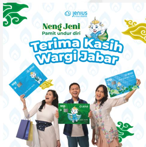
Gambar 4. 26 Share Merchandise

Media terakhir yang penulis gunakan pada tahapan share , yaitu penulis merancang poster digital yang berisi ucapan terima kasih kepada target audience yang sudah turut serta dalam rangkaian promosi edisi