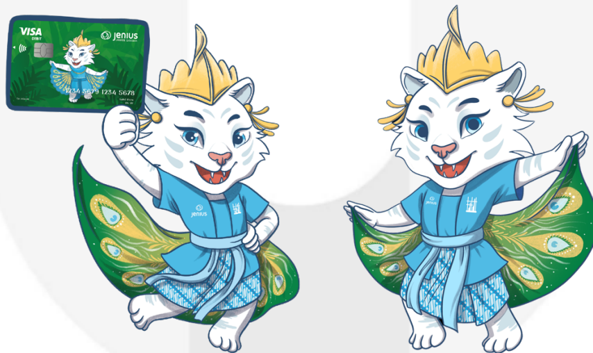
Gambar 2 Maskot Bank Jenius Edisi Jawa Barat

Maskot Neng Jeni dibuat untuk merangkum dari desain kartu yang diperkenalkan sekaligus dirancang pada iklan kreatif Bank Jenius edisi Jawa Barat ini yaitu tarian, batik dan alat musik. Lalu penulis menjadikan “Maung” untuk merepresentasikan Kota Bandung yang dijadikan sebagai tempat promosi Bank Jenius edisi Jawa Barat ini.