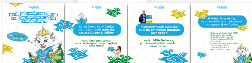
Gambar 4.18 Search Instagram Story

Pada tahapan search ini, perancangan poster digital merupakan perancangan utamanya dan diletakkan pada Instagram Bank Jenius karena pada tahap ini diharapkan target audience sudah mencari tahu mengenai Bank Jenius ke akun Instagram dari Bank Jenius karena sudah diarahkan dari seluruh media pada tahapan attention dan Interes , lalu target audience pun sedang mencari tahu, mengenai kartu debit Bank Jenius edisi Jawa Barat dan fungsi-fungsi dari kartu debit Bank Jenius. Pada perancangan ini, penulis membuat perancangan 6 poster digital yang berisi mengenai apa itu kartu debit Bank Jenius, fungsi dan manfaat dari kartu debit Bank Jenius, desain dari kartu Bank Jenius edisi Jawa Barat, lalu info mengenai bagaimana cara mendapatkan kartu debit Bank Jenius edisi Jawa Barat dan juga manfaat apa saja yang didapatkan oleh pengguna yang baru saja membuat kartu debit Bank Jenius.