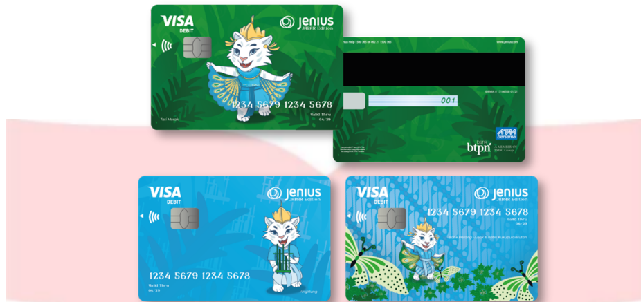
Gambar 1 Kartu Debit Bank Jenius Edisi Jawa Barat

Pada perancangan kartu debit Bank Jenius ini, penulis membagi menjadi 3 kategori, yaitu edisi tari, edisi batik dan alat musik. Kartu edisi tari, penulis menggunakan 3 jenis tari yang berasal dari Jawa Barat yaitu tari merak, tari jaipong dan tari topeng. Lalu kartu edisi batik, penulis menggunakan 4 desain batik dari Jawa Barat yaitu Batik Megamendung, Batik Sawoan, Batik Kukupu-Garutan dan Batik Parang Rusak yang digabungkan menjadi 2 desain kartu debit. Lalu yang terakhir, kartu edisi alat musik, yaitu penulis hanya menggunakan visual angklung. Total dari perancangan kartu debit edisi Jawa Barat ini yaitu 6 kartu edisi.