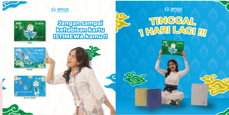
Gambar 4.24 Action Instagram Feeds

Pada tahap action , poster digital dirancang untuk mengingatkan target audience agar membuat kartu debit Bank Jenius edisi Jawa Barat. Poster ini juga mempersuasi mereka yang awalnya tidak tertarik, dengan menekankan edisi terbatas yang hanya tersedia dari 19 hingga 31 Agustus 2024, serta mengajak mereka mengunjungi booth di mall Bank Jenius.