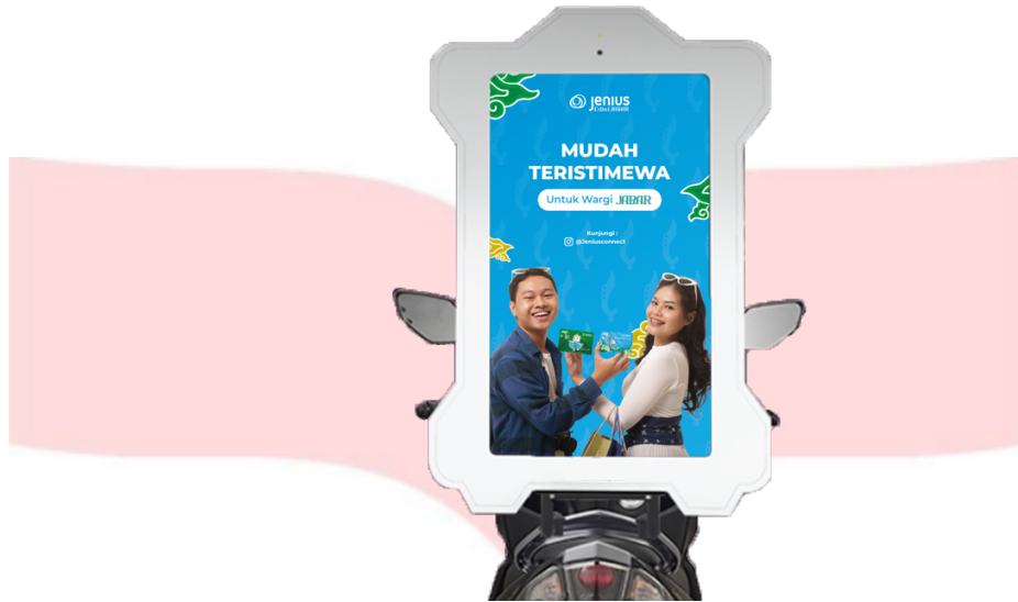
Gambar 4.15 Interest Ojek Ads

Pada tahap interest , penulis merancang poster untuk Ojek Ads guna menjangkau pekerja kantoran, mahasiswa, dan audiens lebih luas. Ojek Ads mendukung media lain dengan menyampaikan pesan secara langsung, seperti kepada pekerja yang melihatnya saat terjebak macet..