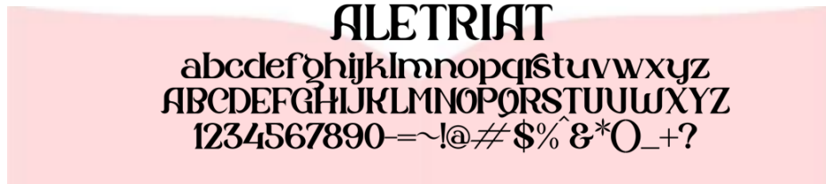
Gambar 3 Jenis Tipografi

MONTSERRAT FAMILY abcdefghijklmnopqrstuvwxy ABCDEFGHIJKLMNPOQRSTUVWXYZ 1234567890-~!@#%&*()_+?