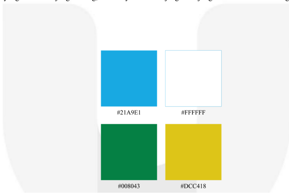
Gambar 4.5 Warna Perancangan

Warna dalam perancangan ini memiliki peran sangat penting untuk membawa suasana dari perancangan desain tematik edisi Jawa Barat ini, karena warna tersebut bisa dijadikan definisi atau mewakili identitas dari Jawa Barat. Dalam perancangan ini penulis mengguna 4 warna, yaitu dengan 2 warna primer yaitu biru dengan kode #21A9E1 dan putih dengan kode #FFFFFF yang bertujuan untuk memberikan identitas dari Bank Jenius. Warna biru tersebut penulis ambil dari warna asli Bank Jenius untuk memperkuat identitas dari Bank Jenius. Warna biru juga merupakan salah satu warna dari identitas Jawa Barat yang melambangkan ketentraman atau kedamaian. Lalu untuk 2 warna sekunder, penulis menggunakan warna kuning dengan kode #DCC418 dan Hijau dengan kode #008043 untuk mendukung suasana dan tema dari Jawa Barat. Warna hijau sendiri merupakan warna utama dari Jawa Barat, karena dianggap sebagai lambang kesuburan dan kemakmuran tanah Jawa Barat, lalu penggunaan warna kuning juga digunakan untuk mendukung suasana dari Jawa Barat yang memiliki arti keagungan.