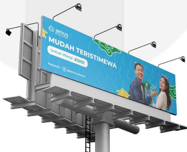
Gambar 4.14 Interest Billboard