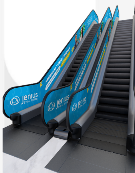
Gambar 4.16 Interest Ambient Media Sumber : (Mudihardjo,2024)

Perancangan ambient media ini akan diletakkan di eskalator pada setiap mall di Kota Bandung yang terdapat booth mall Bank Jenius. Alasan dari penempatan ambient media tersebut yaitu agar menarik perhatian dari pengunjung yang melihat ambient media tersebut dan juga melihat booth mall Bank Jenius, sehingga pengunjung menjadi penasaran dengan apa yang sedang di iklankan dan mulai melirik produk Bank Jenius.