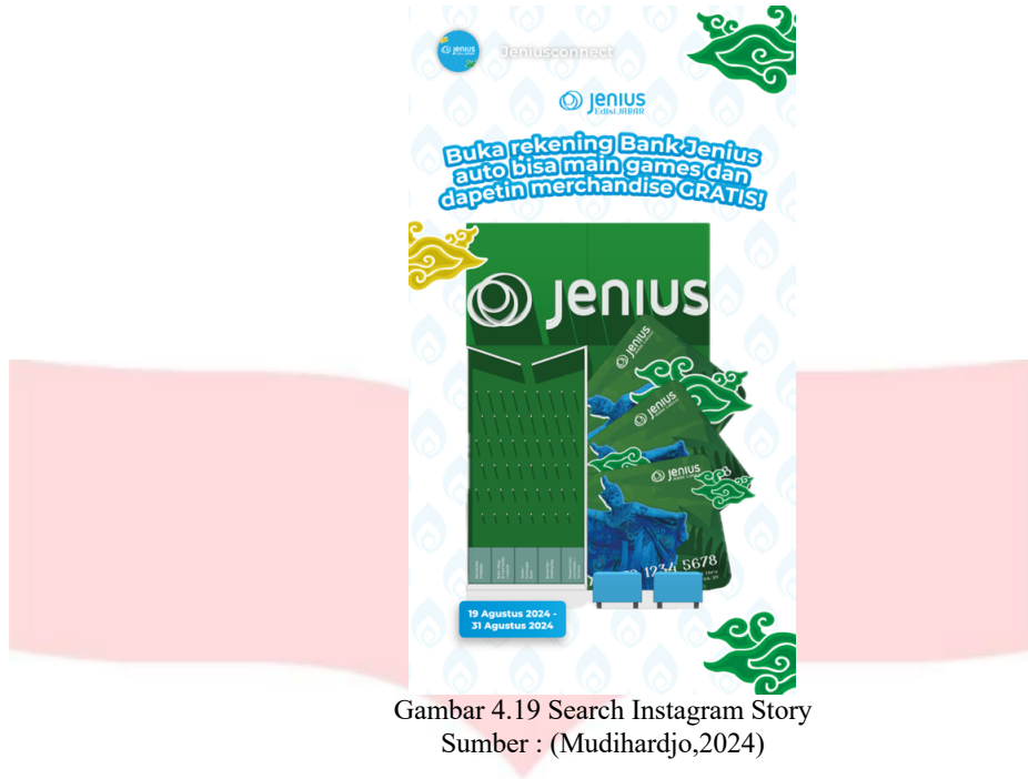
Gambar 4.19 Search Instagram Story

Selain membuat poster digital untuk Instagram feeds , penulis juga merancang poster digital untuk Instagram story yang berisi informasi seputar manfaat ketika target audience membuka rekening atau membuat kartu debit Bank Jenius.