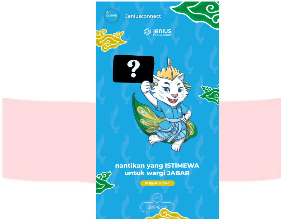
Gambar 4.10 Attention Instagram Story Ads