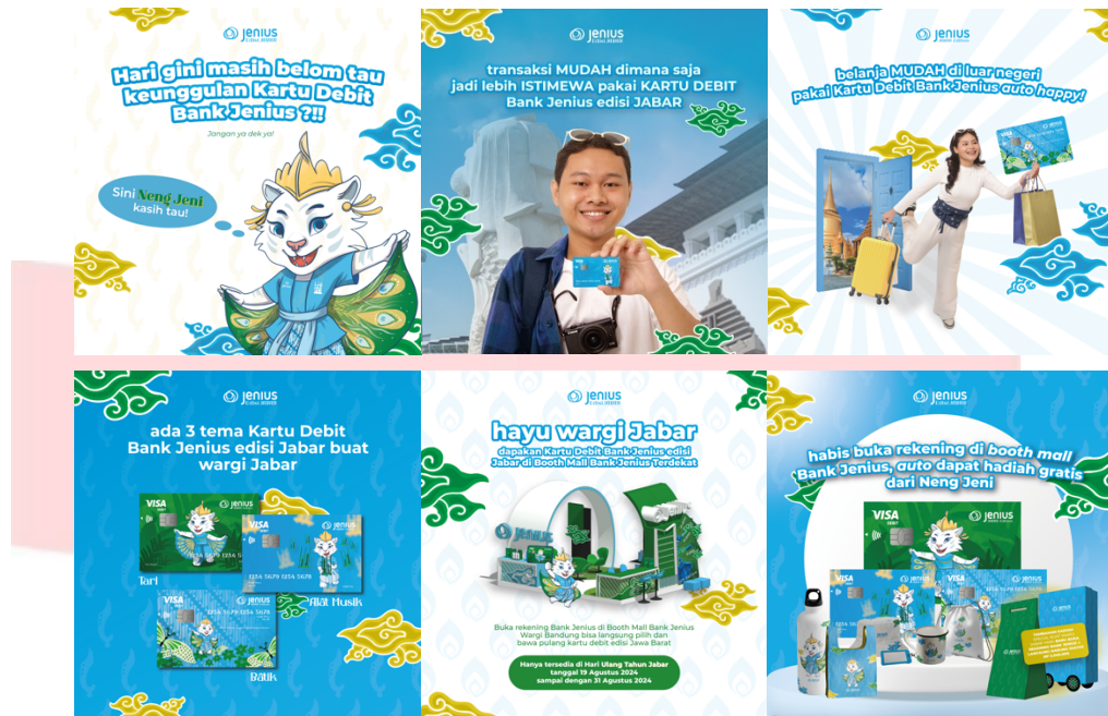
Gambar 4.17 Search Instagram Feeds

Pada tahapan search ini, perancangan poster digital merupakan perancangan utamanya dan diletakkan pada Instagram Bank Jenius karena pada tahap ini diharapkan target audience sudah mencari tahu mengenai Bank Jenius ke akun Instagram dari Bank Jenius karena sudah diarahkan dari seluruh media pada tahapan attention dan Interes , lalu target audience pun sedang mencari tahu, mengenai kartu debit Bank Jenius edisi Jawa Barat dan fungsi-fungsi dari kartu debit Bank Jenius. Pada perancangan ini, penulis membuat perancangan 6 poster digital yang berisi mengenai apa itu kartu debit Bank Jenius, fungsi dan manfaat dari kartu debit Bank Jenius, desain dari kartu Bank Jenius edisi Jawa Barat, lalu info mengenai bagaimana cara mendapatkan kartu debit Bank Jenius edisi Jawa Barat dan juga manfaat apa saja yang didapatkan oleh pengguna yang baru saja membuat kartu debit Bank Jenius.