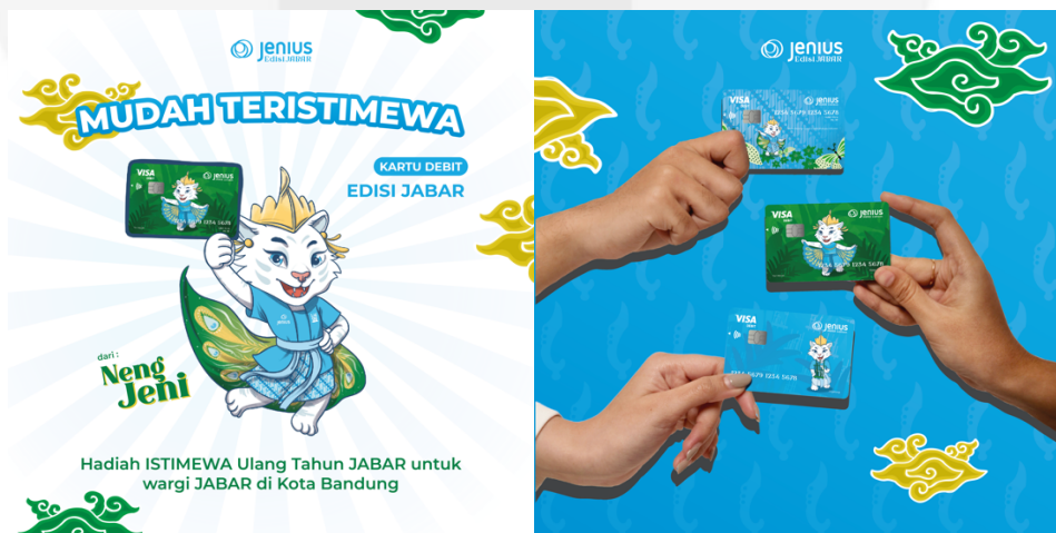
Gambar 4.11 Interest Instagram Feeds