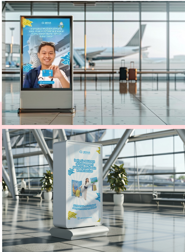
Gambar 4.13 Interest Airport Ads

Setelah merancang poster digital pada tahap interest , penulis juga merancang poster yang dapat dilihat secara offline oleh target audience . Penempatan poster ini dirancang untuk dipasang di bandara, mengingat target audience Bank Jenius adalah mahasiswa dan pekerja kantoran yang gemar bepergian, baik dalam negeri maupun luar negeri. Penulis membuat dua desain poster untuk bandara dengan tetap menggunakan elemen batik Megamendung Cirebon. Poster pertama menampilkan USP ( Unique Selling Proposition ) kartu debit Bank Jenius yang memudahkan transaksi di dalam dan luar negeri, dengan visual Gedung Sate dan Patung Merlion sebagai simbol. Poster kedua menampilkan seorang perempuan yang memegang tas belanja dan koper, dengan latar visual Thailand, yang menggambarkan kemudahan transaksi bagi pelancong. Peletakan poster di bandara dianggap tepat karena mampu menjangkau target audience yang lebih spesifik.