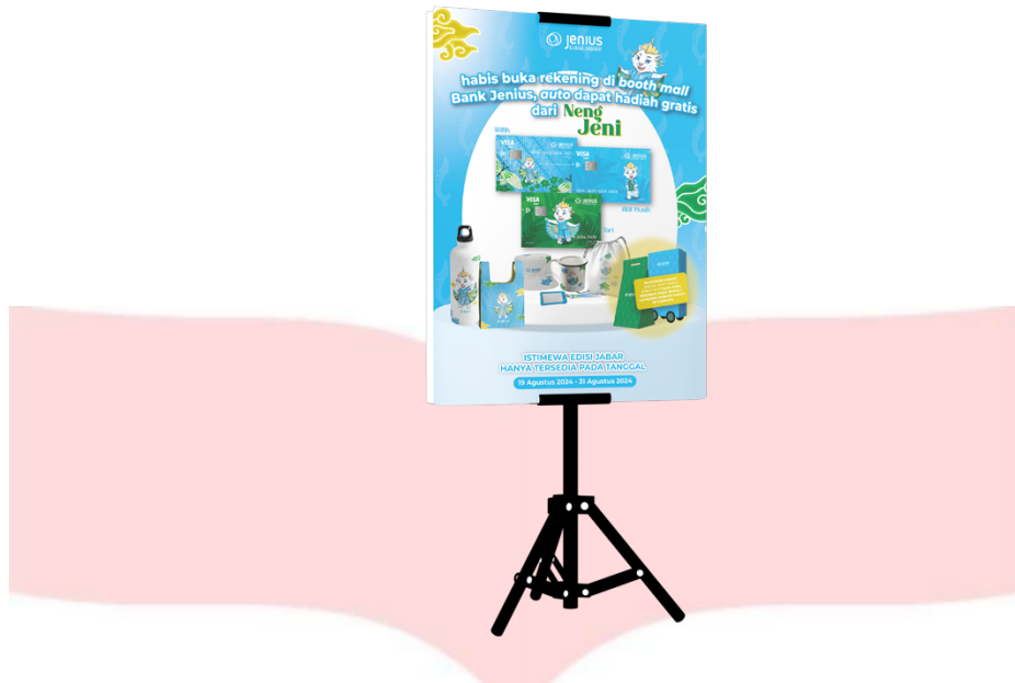
Gambar 4.21 Search Stand Banner Booth Mall

Penulis merancang stand banner untuk booth mall Bank Jenius yang menyoroti manfaat membuka rekening, seperti merchandise gratis dan paket istimewa Neng Jeni bagi yang menabung Rp5.000.000.