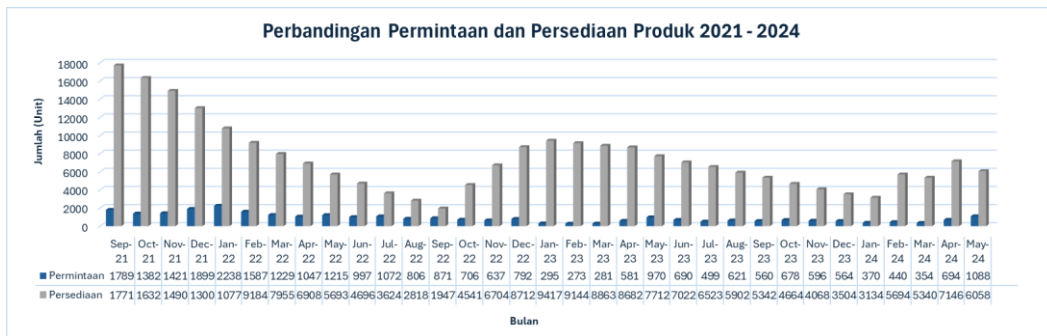
Gambar I 3 Grafik Perbandingan Persediaan dan Permintaan Produk Pada PT BCD Sumber : Data Perusahaan 2021-2023

Berdasarkan Gambar I.2, menunjukkan bahwa permintaan Safety box bersifat probabilistik, dikarenakan pada tahun 2021-2022 permintaan tinggi disebabkan adanya pandemi Covid-19. Namun, pada tahun 2023 dan 2024 pandemi covid sudah mulai menurun sehingga menyebabkan perusahaan mengalami penurunan permintaan secara signifikan. Kondisi tersebut berpengaruh terhadap kondisi persediaan yang menyebabkan perusahaan mengalami penumpukan barang jadi di gudang, biaya persediaan yang tinggi, menyebabkan pemborosan dan kerusakan pada kualitas produk bahkan dapat mempengaruhi rantai pasok dari perusahaan untuk merubah prioritas pesanan, sehingga dapat mengurangi laba perusahaan. Berdasarkan data yang telah diperoleh dari PT BCD, terlihat bahwa terjadi kondisi kesenjangan antara persediaan dan permintaan yang dapat dilihat dari tahun 2021-2024 dan digambarkan dengan grafik pada Gambar I.3.