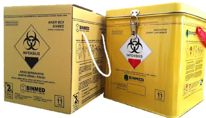
Gambar I 1 Produk PT BCD

Dalam penelitian ini objek yang dituju adalah PT BCD yang merupakan sebuah perusahaan assembling yang bergerak dalam bidang produksi alat kesehatan yaitu wadah limbah medis tajam atau Safety box . PT BCD memiliki produk yang inovatif dan berbeda dari produk Safety box lainnya. Dimana, produk Safety box ini tidak menggunakan bahan plastik seperti produk Safety box lainnya sehingga dapat meminimalisir penggunaan plastik. Selain itu, item Outer can merupakan inovasi baru yang dapat direfill dengan item Inner box . Dua item produk tersebut ditunjukkan pada Gambar I.1.