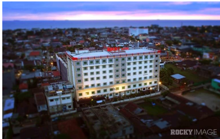
Gambar 1. 2 Tampak Rocky Plaza Hotel Padang

Alamat : Jl. Permindo No. 40 Padang Sumatera Barat Phone / Fax : 0751-840888 / 0751-841230 Website : www.rockyhotelsgroup.com Jumlah Karyawan : 130 orang Jumlah Kamar : 171 Kamar