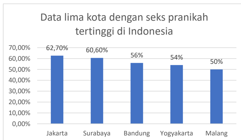
Gambar 1.1 Data lima kota dengan level seks pranikah tertinggi di Indonesia