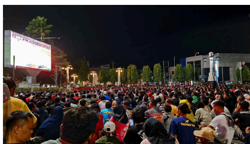
Gambar 1.1 Suasana Streaming Nonton Bareng Timnas Indonesia di Solo

Era pasca-pandemi telah memupuk ekosistem baru, yaitu hadirnya fenomena kultur streaming dan mendorong proliferasi berbagai layanan over the top (Szustak, 2021). Kultur streaming telah menjadi mode hiburan digital yang mendominasi, melibatkan aktivitas seperti menonton film, mendengarkan musik, dan bahkan menonton acara olahraga secara daring melalui internet. Studi dari The Trade Desk (2022) menunjukkan bahwa hampir satu dari tiga orang Indonesia kini terlibat dalam streaming over-the-top (OTT), berkontribusi pada konsumsi konten over-the-top sebesar 3,5 miliar jam per bulan. Kondisi ini tidak hanya berhasil menjadi katalisator transformasi radikal dalam industri hiburan tetapi juga menghadirkan pergeseran signifikan dalam pola konsumsi media. Terlebih lagi, pemerataan perkembangan internet di Indonesia pada tahun 2024 telah mencapai 79.5% dan menjadi rekor tertinggi sepanjang sejarah (Ahdiat, 2024). Sebagai hasilnya, Indonesia muncul ke permukaan sebagai pemimpin nomor satu di Asia Tenggara dengan persentase sebesar 40%, dimana over-the-top menjadi bentuk hiburan utama, memberikan akses kepada masyarakat untuk menonton acara favorit mereka kapan saja, dan di mana saja (The Trade Desk, 2022). Pernyataan ini dapat dilihat dengan maraknya keberadaan tempat-tempat publik yang menayangkan atau mengadakan peristiwa nonton bareng secara streaming melalui layanan over-the-top .