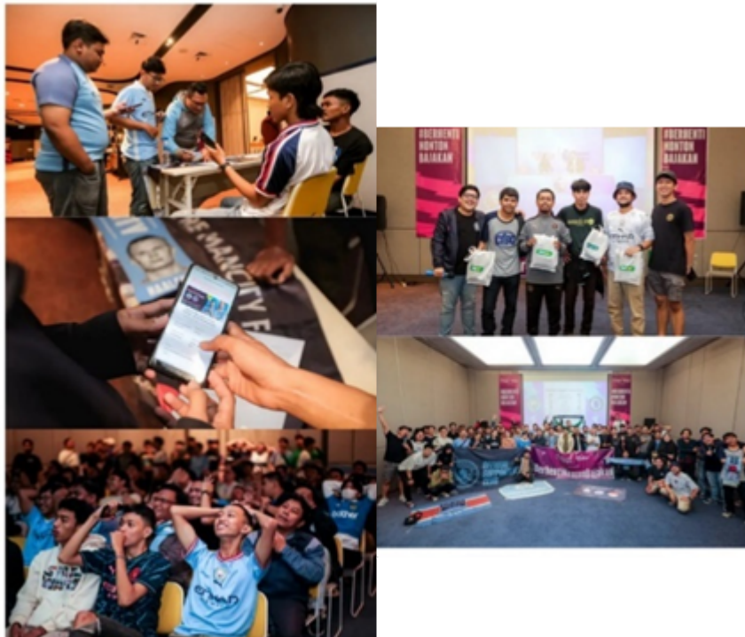
Gambar 1.3 Situasi “Roaring Night” Vidio Manchester City vs Chelsea

Salah satu layanan over-the-top yang mencoba menjembatani kondisi ini adalah broadcaster lokal, yaitu Vidio yang telah berhasil lebih dari 20 kali menyelenggarakan sebuah live experience nonton bareng pertandingan Liga Inggris secara legal yang bertajuk “ Roaring Night ” bersama dengan 11 komunitas liga Inggris di Jakarta.