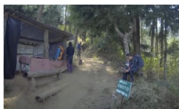
Gambar 3.3 Pos 1 Siroto

Basecamp Mangkukuhan gunung sumbing terletak di dekat persawahan dan bangunannya seperti pondok yang struktur dan hampir semuanya dibangun dengan susunan bambu, tetapi atapnya menggunakan seng. Susunan bambu yang terletak di depan basecamp pada awalnya merupakan pondasi yang dibangun untuk Pembangunan basecamp. Sama seperti yang terlihat dari luar, bagian dalam basecamp juga terlihat menggunakan susunan bambu, di bagian dalam dapat terlihat banyak spanduk-spanduk pendakian yang terpajang disekitar basecamp. Bagian dalam basecamp juga dijadikan tempat parkir motor para relawan yang bertugas, pada bagian kanannya adalah tempat nongkrong yang beralasakan karpet buana tipis berwarna hitam.