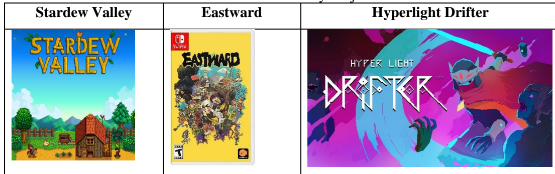
Tabel 3.1 Analisis Karya Sejenis

Dari hasil analisis yang dilakukan, untuk penerapannya dari referensi yang sudah ada pembuatan tiles akan mengacu pada game stardew valley dimana setiap tiles berukuran 16x16, karena ukuran ini sering digunakan pada game pixel art klasik yang grafisnya tidak terlalu kompleks sehingga diharapkan dapat selesai dalam waktu yang tidak banyak ini. Untuk teknik pewarnaan dan penerapan value mengambil referensi dari game eastward , karena pewarnaannya yang menarik dan cukup dapat menggambarkan suasana dari environment yang akan dibuat, selain itu penerapan value yang digunakan game ini juga cukup jelas memperlihatkan elemen elemen yang dapat di interaksi dan tidak membuat pemain kebingungan. Teknik shading sendiri akan menggunakan dithering dan flat shading untuk membuat visual dengan detail yang lebih jelas. Pada kejadian kebakaran teknik pewarnaan dan value akan lebih mengikuti game Hyper Light Drifter karena dirasa lebih pas menggambarkan suasana mencekam saat terjadi kebakaran hutan.