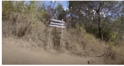
Gambar 3.5 Pos 3 Petai Cina