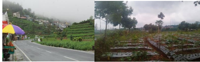
Gambar 3.1 Landscape perkebunan Wonosobo

Gunung Sumbing adalah salah satu gunung yang terletak di Provinsi Jawa Tengah, Indonesia, yang secara administratif terletak di tiga kabupaten yaitu Kabupaten Wonosobo, Kabupaten Magelang dan Kabupaten Temanggung. Jika dipandang dari arah Temanggung Gunung Sumbing dan Gunung Sindoro membentuk bentang alam gunung kembar.