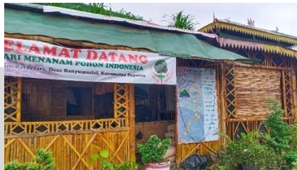
Gambar 3.2 Landscape perkebunan Wonosobo

Di daerah bawah yang memiliki dataran yang rata perkebunan warga dibuat seperti biasanya dengan gundukan gundukan tanah yang di tutupi plastik mulsa. Pada daerah yang lebih tinggi dengan lahan yang miring perkebunan dibuat dengan teknik terasering.