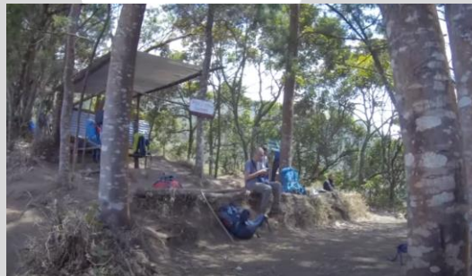
Gambar 3.4 Pos 2 Bidoblang

Perjalanan dari pos 1 ke pos 2 didapati pemandangan banyak pohon tumbang yang sedikit mengganggu jalan pendakian tetapi tetap dibiarkan. Di perjalanan juga akan ditemukan persimpangan dimana menurut keterangan salah satu jalur terdapat larangan karena merupakan hutan sukma yang jalurnya lebih miring. pendaki diharuskan melewati jalan memutar yang lebih landai.