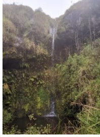
Gambar 3.1 Curug Putri Sejati

Curug putri Sejati terletak di pos 4 bayangan jalur pendakian basecamp mangkukuhan. Curug ini mengalirkan air yang deras dari atas dan pada bagian dalam airnya berisi bebatuan yang umumnya dijumpai di Sungai dari yang ukuran kecil ke besar. Bisa dilihat pada lingkungan sekitarnya curug ini di kelilingi tumbuhan seperti tanaman paku dan semak belukar.