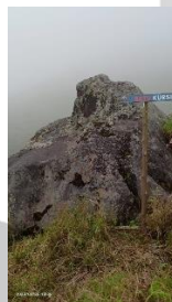
Gambar 3.6 Batu Kursi

Area kemp Lembah suci berada pada ketinggian 2618 Mdpl. Di kemp ini terdapat lahan panjang dengan 5 baris seperti sengkedan yang tidak terlalu tinggi, lahan ini yang biasa dipakai pendaki untuk memasang tenda. Pada bagian kiri ada shelter berbentuk segitiga yang jika dilihat cukup luas untuk dimasuki sampai 10 orang. Ada juga kerangka bangunan besar yang sepertinya direncanakan untuk membuat shelter. Pohon dan tumbuhan yang tumbuh pada area ini kebanyakan pohon akasia, baik yang kecil atau besar. Selain itu banyak ditemukan tumbuhan edelweiss. Tanda atau sign disini dibuat menggunakan kayu.